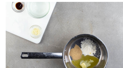
3. Sauce köcheln

Den Schnittlauch in dünne Röllchen schneiden. 2EL Schnittlauch mit 4EL Mayonnaise verrühren und mit Salz und Pfeffer abschmecken. Den restlichen Schnittlauch in die Sauce rühren.