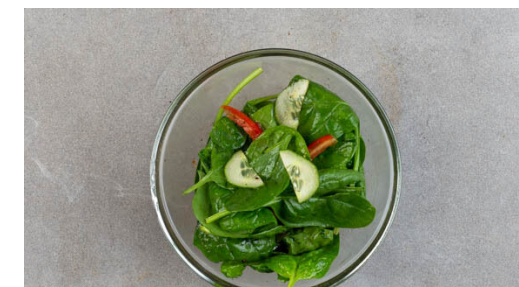
6. Salat fertigstellen

Den Knoblauch schälen und fein würfeln. 1EL Butter in einem mittelgroßen Topf bei niedriger Hitze schmelzen lassen. 1EL Mehl ca. 30Sek. unterrühren, dann den Knoblauch , die Misopaste und 400ml heißes Wasser hinzufügen. Alles gut verrühren, kräftig mit Pfeffer würzen und aufkochen. lassen. Dann die Sauce bei niedriger Hitze 10-12Min. köcheln lassen, dabei gelegentlich umrühren.