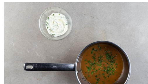
5. Dip anrühren

2EL Sojasauce mit 2EL Olivenöl und 3EL Balsamicoessig verrühren. Die Pilze rundum mit dem Würzöl bepinseln und mit der Außenseite nach oben in eine mit Backpapier ausgelegte Auflaufform geben. Im unteren Teil des Ofens 10-12Min. backen, bis die Pilze gar sind. Den Pilzbratensaft aufbewahren.