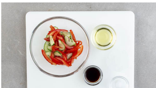
4. Salat vorbereiten

Den Backofen auf 240°C (220°C Umluft) vorheizen. Die Kartoffeln samt Schale in ca. 1cm breite Spalten schneiden und auf einem mit Backpapier ausgelegten Backblech mit 2EL Olivenöl und je 1 kräftigen Prise Salz und Pfeffer vermengen. Im Ofen 25-30Min. goldbraun backen, dabei zur Hälfte der Garzeit einmal wenden.