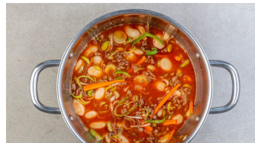
2. Sauce köcheln

Zwei 30x20cm große Auflaufformen mit je ½EL Butter einfetten. Die Lasagnen abwechselnd mit Käsesauce , Lasagneplatten , Hacksauce und wieder Lasagneplatten aufschichten. Die erste und die letzte Schicht sollte aus Käsesauce bestehen.