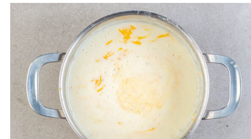
3. Käsesauce anrühren

Beide Lasagnen mit dem restlichen Cheddar bestreuen, dann im Ofen ca. 25Min. backen, bis die Lasagnen köcheln und der Cheddar goldbraun ist. Tipp: Ggf. mit Alufolie abdecken, falls die Lasagnen zu trocken oder dunkel werden.