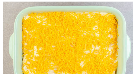
5. Lasagnen backen

Die Bohnen in einem Sieb mit kaltem Wasser abspülen und abtropfen lassen. In demselben Topf den Gemüsemix mit 2EL Olivenöl bei niedriger bis mittlerer Hitze in 3-5Min. weich braten, dann das Tomatenmark , das Hackfleisch , die Bohnen und 800ml Wasser zugeben und 8-10Min. köcheln lassen. Mit 1TL Salz und reichlich Pfeffer würzen.