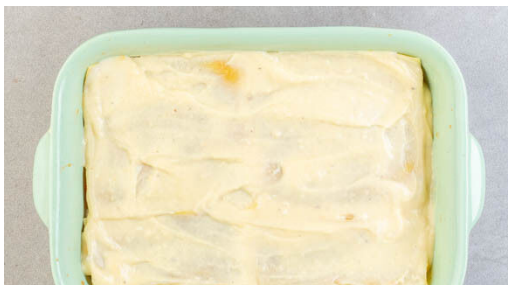
4. Lasagne schichten

Den Backofen auf 200°C (180°C Umluft) vorheizen. Den Knoblauch schälen und sehr fein würfeln oder durch eine Knoblauchpresse drücken. Das Hackfleisch , die Gewürzmischung und den Knoblauch in einem großen Topf mit 2EL Olivenöl bei mittlerer Hitze 3-4Min. anbraten, bis das Hackfleisch anfängt zu bräunen, dann aus dem Topf nehmen und beiseitestellen.