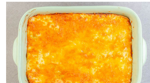
6. Anrichten & servieren

6EL Butter in einem mittelgroßen Topf bei niedriger Hitze schmelzen lassen, dann 6EL Mehl mit einem Schneebesen einrühren, bis eine Paste entsteht. 2TL Senf einrühren, dann nach und nach 600ml Milch und 200ml Wasser einrühren, bis eine Sauce entsteht. Die ½ des Cheddars einrühren und schmelzen lassen, dann mit je 1TL Salz und Pfeffer würzen.