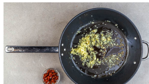
2. Zwiebeln anbraten

Die Spätzle hinzugeben und 3-4Min. mitbraten, dann mit 400ml Milch ablöschen und ca. 1Min. leicht einköcheln lassen. Die Basilikumcreme unterrühren und mit Salz und Pfeffer abschmecken.