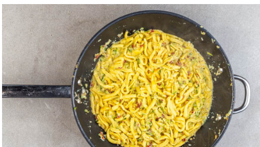
4. Spätzle mitbraten

Den Backofen Ober-/Unterhitze auf 250°C vorheizen. Tipp: Falls vorhanden, die Grillfunktion zuschalten. Die Zucchini mit einer Küchenreibe grob raspeln, mit ½TL Salz vermischen und ca. 5Min. ziehen lassen.