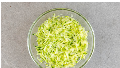
1. Zucchini reiben

Energie 828kcal, Fett 45.5g, Kohlenhydrate 73.2g, Eiweiß 30.6g