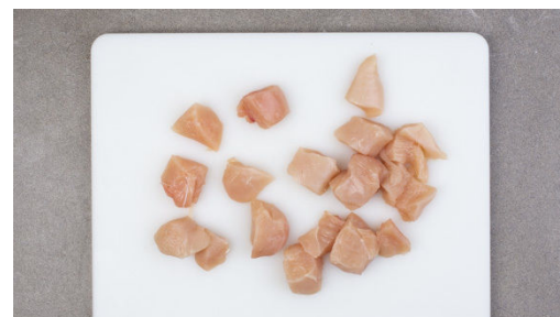
2. Fleisch trocken tupfen

Die Gnocchi in einer großen Pfanne mit 1EL Olivenöl bei mittlerer Hitze 8-10Min. goldbraun anbraten. Mit Salz und Pfeffer sowie Limettenschale und Limettensaft nach Geschmack würzen.