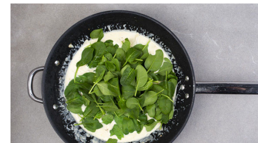
6. Sauce zubereiten

Die Limettenschale abreiben, dann die Limette halbieren und auspressen.