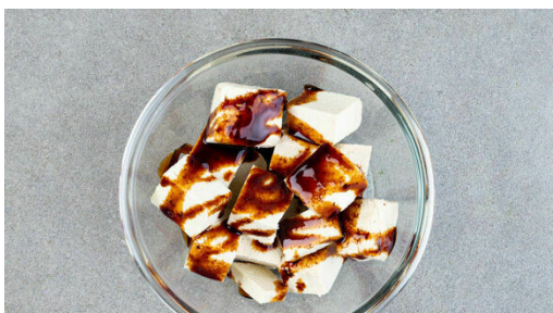
1. Tofu vorbereiten

Energie 710kcal, Fett 35.1g, Kohlenhydrate 67.5g, Eiweiß 27.1g