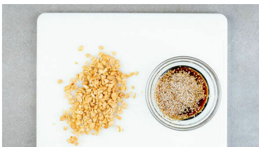
4. Dressing zubereiten

Den Tofu trocken tupfen und in ca. 2cm große Würfel schneiden. Den Ingwer schälen und fein reiben. Die Teriyakisauce mit dem Ingwer und dem Tofu vermengen und den Tofu in der Würzsauce ziehen lassen.