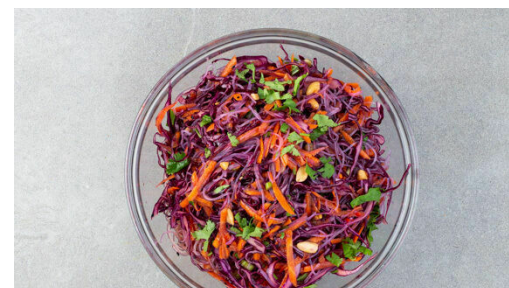
5. Salat mischen

In einem mittelgroßen Topf ausreichend gesalzenes Wasser für die Nudeln aufkochen. Die Karotten ggf. schälen und grob raspeln. Den Koriander samt Stängeln fein schneiden. Die Lauchzwiebeln in feine Ringe schneiden. Die Peperoni längs halbieren und fein würfeln. Tipp: Für weniger Schärfe die Kerne entfernen.