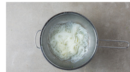
3. Nudeln garen

Den Rotkohl in feine Streifen schneiden und mit den Nudeln , den Karotten , den Lauchzwiebelringen , den Erdnüssen , der 1/2 des Korianders , dem Dressing und der Peperoni nach Geschmack vermengen. Mit Salz und Pfeffer abschmecken.