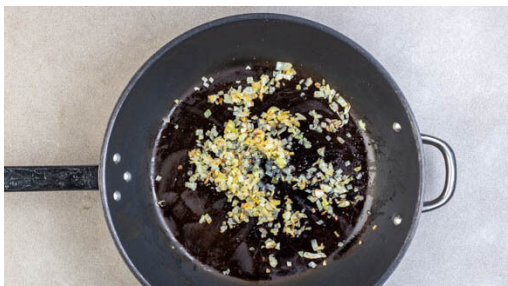
1. Zwiebel braten

Energie 815kcal, Fett 39.9g, Kohlenhydrate 67.3g, Eiweiß 41.4g