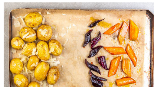
5. Gemüse verfeinern

Die Karotten ggf. schälen, längs halbieren und schräg vierteln, dann auf einem mit Backpapier ausgelegten Backblech mit 1EL Olivenöl und je 1 kräftigen Prise Salz und Pfeffer vermengen. Die Kartoffeln daneben mit 1EL Olivenöl und je 1 kräftigen Prise Salz und Pfeffer vermengen. Das Gemüse im Ofen 15-20Min. rösten.