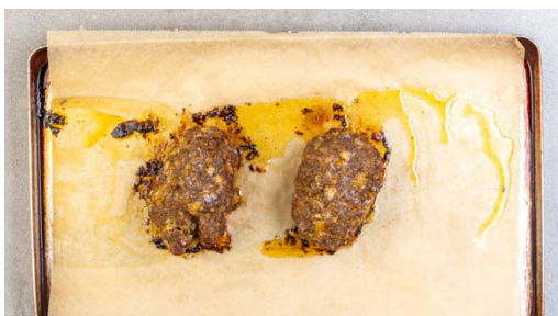
4. Hackbraten backen

Den Backofen auf 220°C (200°C Umluft) vorheizen. Die Zwiebel schälen, halbieren und fein würfeln, dann in einer mittelgroßen Pfanne mit 1EL Olivenöl und 1 Prise Salz bei mittlerer Hitze in 3-5Min. glasig braten, dabei gelegentlich umrühren. Die Pfanne vom Herd nehmen und abkühlen lassen.