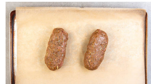
3. Hackbraten vorbereiten

Die Karotten mit der Balsamicocreme vermengen. Den Käse über die Kartoffeln streuen. Die Karotten und die Kartoffeln im Ofen weitere 5Min. rösten.