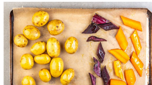
2. Gemüse rösten

Wenn das Gemüse 15-20Min. gebacken hat, das Blech mit den Hackbraten über dem Gemüse positionieren und die Hackbraten in 15-18Min. goldbraun und gar backen.