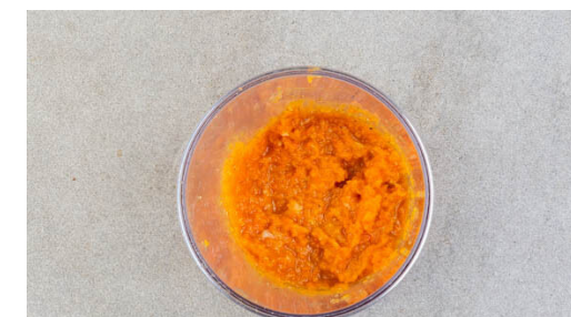
6. Fertigstellen & servieren

Den Knoblauch in der Pfanne mit 3EL Olivenöl bei mittlerer bis starker Hitze ca. 2Min. goldbraun anbraten. Den Knoblauch aus der Pfanne nehmen und beiseitestellen. Das Fleisch in die Pfanne geben und von jeder Seite 2-3Min. braten, bis es leicht gebräunt und gar ist.