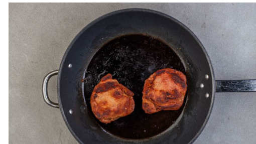
5. Steaks braten

Inzwischen die Paprika vierteln und entkernen. Den Knoblauch schälen und grob würfeln. Die Petersilie samt Stängeln fein hacken. Das Sauerkraut in einem Sieb mit kaltem Wasser abspülen und abtropfen lassen.