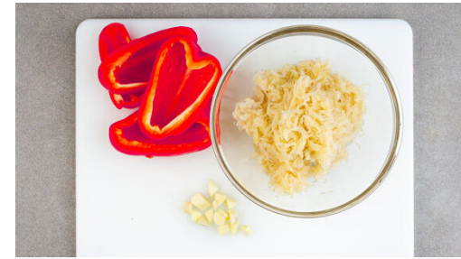
2. Gemüse vorbereiten

Den Knoblauch in einer mittelgroßen Pfanne mit 2EL veganer Margarine bei niedriger bis mittlerer Hitze ca. 30Sek. anbraten. Das Sauerkraut untermengen, in 1-2Min. erwärmen und aus der Pfanne nehmen. Die Pfanne auswaschen.