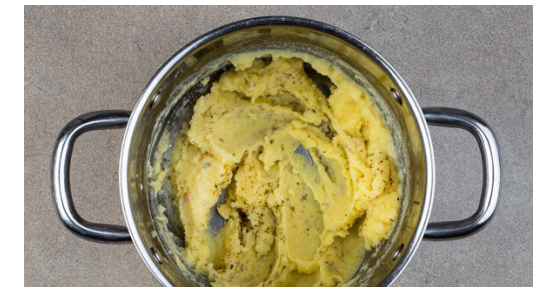
6. Kartoffeln pürieren

Die Paprika mit der Schnittseite nach oben auf einem mit Backpapier ausgelegten Backblech verteilen und mit 1TL Balsamicoessig sowie 1EL Pflanzenöl beträufeln, mit 1 kräftigen Prise Salz würzen und im Ofen unter dem Grill ca. 10Min. rösten, bis die Haut anfängt, Blasen zu werfen.