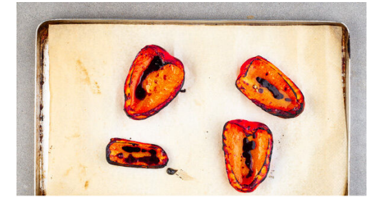
3. Paprika grillen

Die vegane Steaks trocken tupfen, mit Salz und Pfeffer würzen und in der Pfanne mit 1EL Pflanzenöl bei starker Hitze auf jeder Seite 2-3Min. braten, abhängig davon, ob sie medium oder eher durchgebraten sein sollen. Aus der Pfanne nehmen und bis zum Servieren auf einem Teller abgedeckt ruhen lassen.