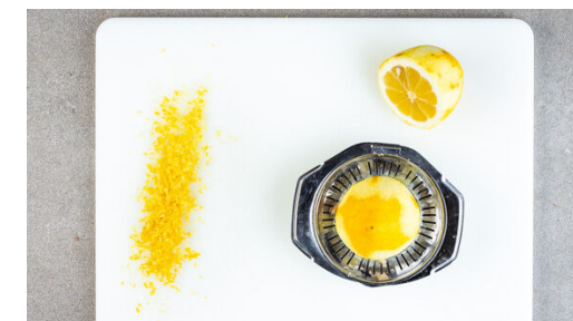
3. Zitrone vorbereiten

Die Walnüsse in einer kleinen Pfanne ohne Zugabe von Fett bei mittlerer Hitze 1-2Min. anrösten. Vorsicht , sie können schnell zu dunkel werden. Aus der Pfanne nehmen und kurz abkühlen lassen. Die Basilikumblätter abzupfen und mit den Walnüssen sowie der Zitronenschale fein hacken, dann mit 2TL Olivenöl vermengen. Die Gremolata mit je 1 Prise Salz und Pfeffer würzen.