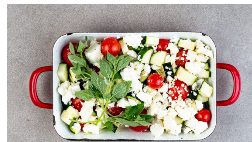
2. Gemüse und Feta backen

300g Pasta in das kochende Wasser geben und in 7-9Min. bissfest kochen. 250ml Pastawasser abschöpfen, dann die Pasta in ein Sieb abgießen und abtropfen lassen.