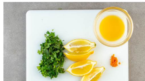
5. Kräuter schneiden

Den Gemüsemix in die Pfanne geben und ca. 5Min. mitbraten. Währenddessen das Brühgewürz in 200ml warmem Wasser auflösen.