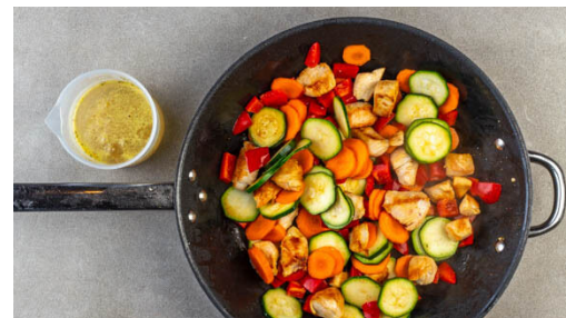
2. Gemüse mitbraten

Währenddessen in einem kleinen Topf 300ml leicht gesalzenes Wasser zum Kochen bringen. Den Topf vom Herd nehmen, den Couscous und die Gewürzmischung in das kochende Wasser rühren und abgedeckt 6-8Min. quellen lassen. Den Couscous mit einer Gabel auflockern.