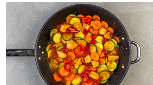
3. Eintopf zubereiten

Die Minzeblätter von den Stängeln zupfen und mit der Petersilie grob schneiden. Die Orangenschale fein abreiben, dann die Orange halbieren und auspressen. Die Zitrone in Spalten schneiden.