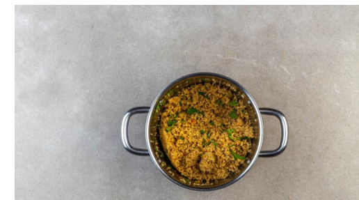
6. Couscous verfeinern

Die Harissa unterrühren, dann langsam die Brühe angießen. Mit 1 Prise Salz und 1TL Zucker würzen und bei mittlerer Hitze ca. 8Min. köcheln lassen. Mit ggf. mehr Salz und Zucker abschmecken.