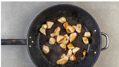
1. Fleisch braten

Energie 683kcal, Fett 19.0g, Kohlenhydrate 90.1g, Eiweiß 38.6g