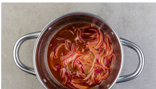
1. Zwiebeln einköcheln

Energie 788kcal, Fett 41.6g, Kohlenhydrate 70.5g, Eiweiß 30.7g