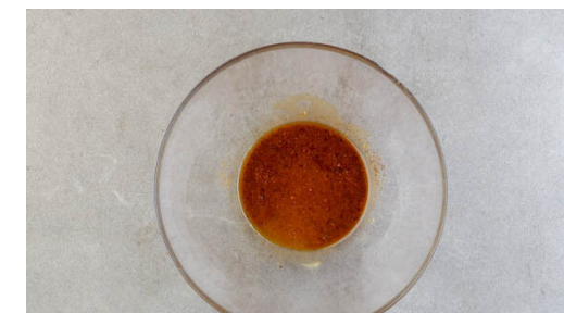
3. Dressing anrühren

Die Pattys in einer großen Pfanne mit 1EL Olivenöl bei mittlerer bis starker Hitze 3-4Min. braten. Dann wenden, mit der ½ des Käses belegen und abgedeckt 3-4Min. weiterbraten, bis der Käse geschmolzen und das Fleisch gar ist. Auf einem Teller abgedeckt warm halten. Die Süßkartoffelpommes auf Teller verteilen und, falls vorhanden, die Grillfunktion des Ofens einschalten.