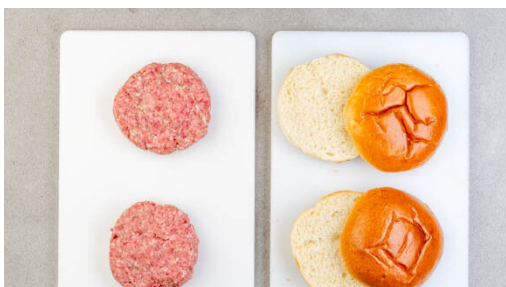
4. Pattys formen

Den Backofen auf 220°C (200°C Umluft) vorheizen. Die Zwiebeln schälen, halbieren und in feine Streifen schneiden. In einem mittelgroßen Topf mit 1EL Butter, 5EL Balsamicoessig, 2EL Wasser, 3EL Zucker sowie je 1 kräftigen Prise Salz und Pfeffer bei niedriger bis mittlerer Hitze 8-10Min. köcheln lassen, bis die Zwiebeln weich und marmeladenartig eingekocht sind.