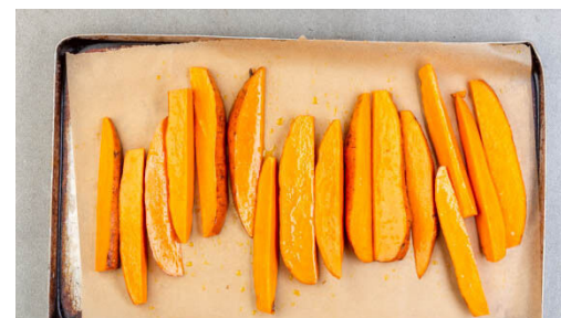
2. Süßkartoffeln backen

Den Knoblauch schälen und fein reiben. In einer Schüssel das Hackfleisch mit dem geriebenen Knoblauch und je 1 kräftigen Prise Salz und Pfeffer vermengen, dann zu 4 gleich großen Pattys formen. Die Brötchen aufschneiden.