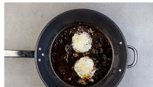
5. Pattys braten

Die Süßkartoffeln samt Schale längs halbieren und in pommesartige Stifte schneiden. Auf einem mit Backpapier ausgelegten Backblech verteilen, mit 2EL Olivenöl und ½TL Salz vermengen und 20-25Min. im Ofen backen. Nach der Hälfte der Backzeit wenden.