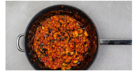
3. Gemüse garen

Den Fisch mit etwas Küchenkrepp trocken tupfen, evtl. vorhandene Gräten mit einer Pinzette entfernen. Den Fisch rundum mit 1EL Olivenöl sowie Salz und Pfeffer einreiben und auf ein mit Backpapier ausgelegtes Backblech geben. Die Nussmischung auf dem Fisch verteilen und den Fisch 4-6Min. im Ofen backen, bis der Fisch gar ist.