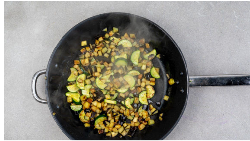
1. Gemüse anbraten

Energie 444kcal, Fett 32.4g, Kohlenhydrate 13.3g, Eiweiß 28.4g