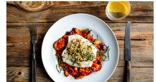
6. Anrichten und servieren

Die Thymianblättchen , die Basilikumstängel und den Knoblauch zum Gemüse in die Pfanne geben und 1Min. mitbraten. Die gehackten Tomaten dazugeben, dann 1 leere Dose zur Hälfte mit Wasser füllen und ebenfalls in die Pfanne gießen. Alles aufkochen und anschließend abgedeckt bei niedriger Hitze ca. 15Min. sanft köcheln lassen.