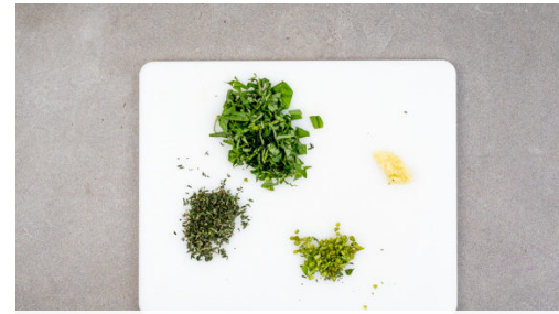
2. Kräuter schneiden

Die Walnüsse fein hacken und mit ca. 2/3 der Basilikumblätter , 1-2EL Olivenöl, 1/2TL Salz sowie Pfeffer nach Geschmack vermengen.