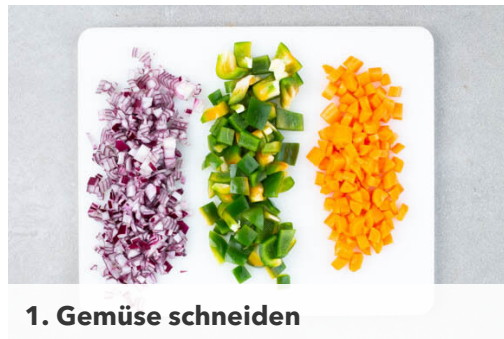
1. Gemüse schneiden

Energie 476kcal, Fett 20.3g, Kohlenhydrate 45.4g, Eiweiß 22.8g