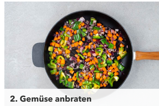
2. Gemüse anbraten

Die Süßkartoffeln schälen und in 0,5-1cm große Würfel schneiden. Die Paprika halbieren, entkernen und in ca. 1cm große Würfel schneiden. Die Zwiebel schälen, halbieren und fein würfeln.