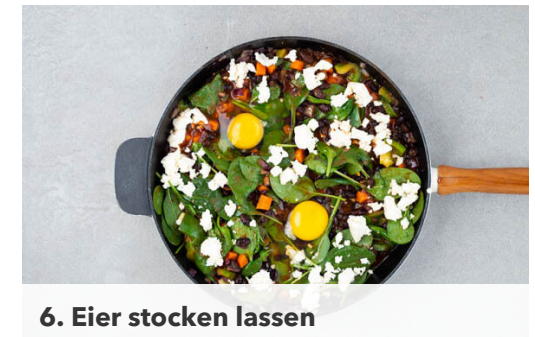
6. Eier stocken lassen

Die Bohnen unterrühren, dann ca. 2/3 des Spinats unterheben und zusammenfallen lassen.