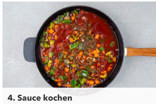
4. Sauce kochen

Die Bohnen in ein Sieb abgießen, kalt abspülen und abtropfen lassen. Den Knoblauch schälen und fein würfeln.