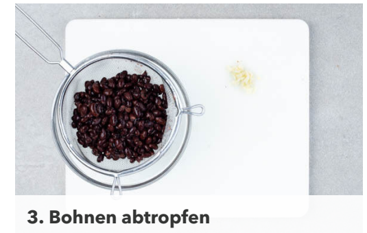
3. Bohnen abtropfen

Das Gemüse in einer großen Pfanne mit 2EL Olivenöl bei mittlerer bis starker Hitze 8-10Min. anbraten. Mit Salz, Pfeffer und 1 Prise Zucker würzen.