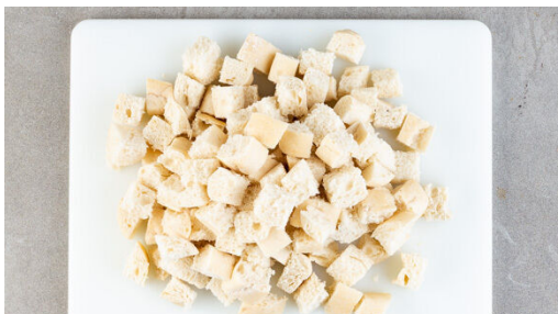
1. Brot schneiden

Energie 848kcal, Fett 33.3g, Kohlenhydrate 109.9g, Eiweiß 28.1g