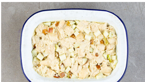
4. Brotpudding backen

Den Backofen auf 240°C (220°C Umluft) vorheizen. Die Brötchen zuerst in ca. 2cm dicke Scheiben, dann in ca. 2cm kleine Würfel schneiden.