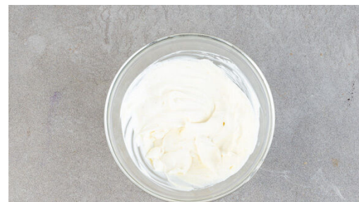
5. Joghurt verfeinern

3 Eier mit 375ml Milch und 1½EL Zucker verquirlen.