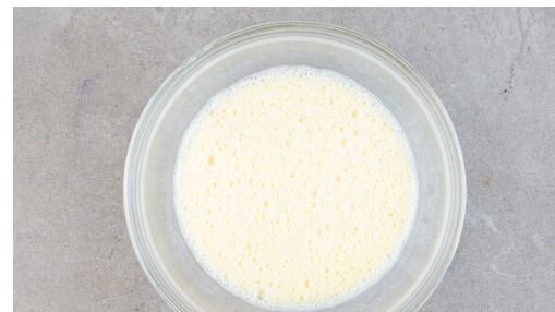
2. Guss vorbereiten

Die Brötchenwürfel , die Birnen und die Rosinen mit dem Eier-Milch-Guss vermengen. Eine große Auflaufform dünn mit 2EL Butter fetten und mit 1½EL Zucker ausstreuen, dann die Brötchenmasse gleichmäßig in der Form verteilen und 15-20Min. im Ofen knusprig backen.