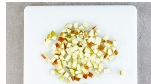
3. Birnen schneiden

1½ Becher Joghurt mit 1TL Zucker verrühren.