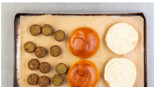
4. Brötchen aufbacken

Den Backofen auf 200°C (180°C Umluft) vorheizen. Die Gurke der Länge nach vierteln, dann quer in ca. 1cm breite Stücke schneiden. Die ½ der Zwiebel schälen und in feine Streifen schneiden. Tipp: Wer mag, kann auch mehr Zwiebel verwenden. Die Tomaten grob würfeln.