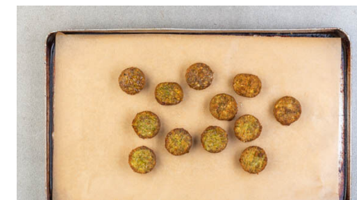
3. Falafeln aufbacken

Die Gurken , die Zwiebeln und die Tomaten mit dem Rucola und der Tahinisauce vermengen.