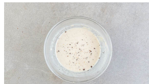
2. Sauce vorbereiten

Die Brötchen halbieren und in den letzten 3-4Min. zu den Falafeln aufs Blech geben und knusprig aufbacken.