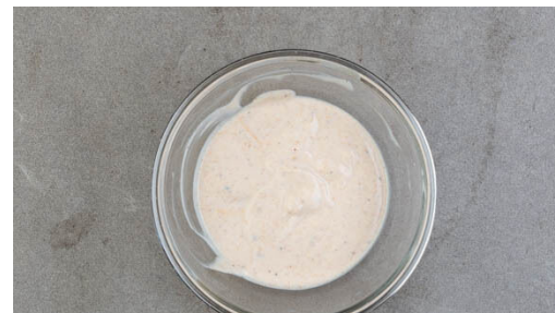
5. Sauce zubereiten

Die Zwiebeln schälen, halbieren und in dünne Streifen schneiden. In einer großen Pfanne mit 2EL Olivenöl und 1 kräftigen Prise Salz bei starker Hitze 1-2Min scharf anbraten, dann auf mittlere bis niedrige Hitze reduzieren, 1TL Zucker unterrühren und weitere 6-8Min. weich braten, dann vom Herd nehmen und bis zum Servieren beiseitestellen.