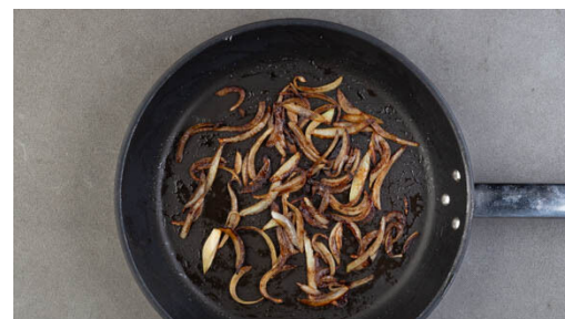
2. Zwiebeln braten

1EL Zucker und je ½TL Salz und Pfeffer in 4EL hellem Essig auflösen. Den Sellerie schälen und grob reiben, dann die Essigmischung einmassieren, damit der Sellerie weicher wird. Den grünen und weißen Teil der Lauchzwiebeln getrennt in dünne Ringe schneiden, die weißen Lauchzwiebelringe mit 4EL Mayonnaise unter den Sellerie mischen.