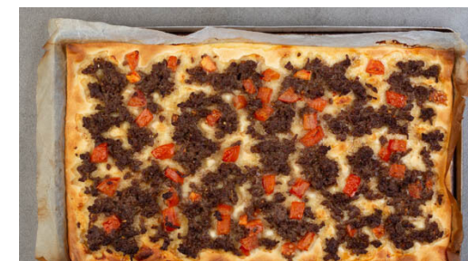
3. Flammkuchen backen

Den Joghurt mit der restlichen Gewürzmischung , dem restlichen Knoblauch , je 1 kräftigen Prise Salz und Pfeffer sowie 1½EL Wasser zu einer Sauce verrühren, ggf. noch etwas Wasser zugeben. Mit Salz und Pfeffer abschmecken.