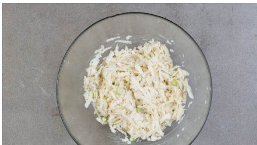
4. Sellerie-Slaw anmachen

Den Backofen auf 220°C (200°C Umluft) vorheizen. Den Knoblauch schälen und sehr fein würfeln. Die Tomaten in ca. 1cm große Würfel schneiden. Das vegane Hack mit den Tomaten , der ½ des Knoblauchs , ⅔ der Gewürzmischung , 2EL Olivenöl sowie je ½TL Salz und Pfeffer vermengen.