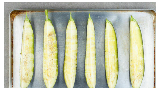
2. Auberginen backen

Die Kirschtomaten halbieren. Die Minzeblätter von den Stängeln zupfen und fein schneiden. Den Koriander samt Stängeln ebenfalls fein schneiden. Die Zitronenschale abreiben, dann die Zitronen halbieren und auspressen. Die Tomaten mit der ½ der Kräuter , 2EL Zitronensaft und je 1 kräftigen Prise Salz und Pfeffer vermengen.