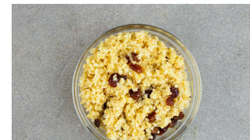
6. Bulgur verfeinern

Die Kichererbsen in einem Sieb kalt abspülen, abtropfen lassen und mit etwas Küchentuch trocken tupfen. Dann mit 1TL Gewürzmischung , 2EL Olivenöl und je 1 kräftigen Prise Salz und Pfeffer vermengen und während der letzten ca. 12Min. der Backzeit mit zu den Auberginen auf das Backblech geben und mitbacken.