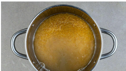
1. Bulgur kochen

Energie 836kcal, Fett 34.3g, Kohlenhydrate 105.2g, Eiweiß 19.8g