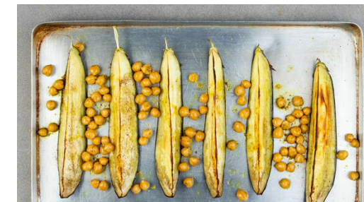
3. Kichererbsen mitbacken

Den Knoblauch schälen und in einem hohen Gefäß mit den Oliven , 2TL Zitronenschale , 1TL Gewürzmischung , 3-4EL Zitronensaft , 4EL Olivenöl , 3-4EL Wasser und je 1 kräftigen Prise Salz, Pfeffer und Zucker mit einem Stabmixer zu einem glatten Dressing pürieren.