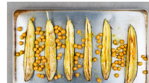
3. Kichererbsen mitbacken

Den Knoblauch schälen und in einem hohen Gefäß mit den Oliven , 1TL Zitronenschale , ½TL Gewürzmischung , 2EL Zitronensaft , 2EL Olivenöl , 1-2EL Wasser und je 1 Prise Salz, Pfeffer und Zucker mit einem Stabmixer zu einem glatten Dressing pürieren.