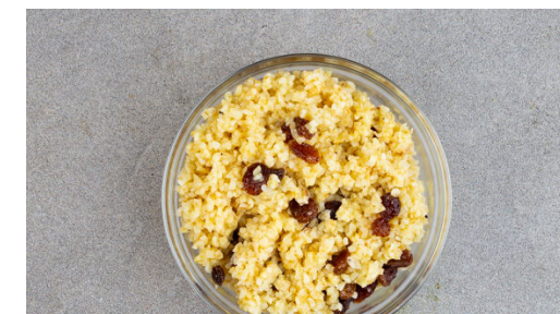
6. Bulgur verfeinern

Die Kichererbsen in einem Sieb kalt abspülen, abtropfen lassen und mit etwas Küchenkrepp trocken tupfen. Dann mit ½TL Gewürzmischung , 1EL Olivenöl und je 1 Prise Salz und Pfeffer vermengen und während der letzten ca. 12Min. der Backzeit mit zu den Auberginen auf das Backblech geben und mitbacken.