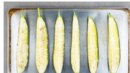
2. Auberginen backen

Die Kirschtomaten halbieren. Die Minzeblätter von den Stängeln zupfen und fein schneiden. Den Koriander samt Stängeln ebenfalls fein schneiden. Die Zitronenschale abreiben, dann die Zitrone halbieren und auspressen. Die Tomaten mit der ½ der Kräuter , 1EL Zitronensaft und je 1 Prise Salz und Pfeffer vermengen.