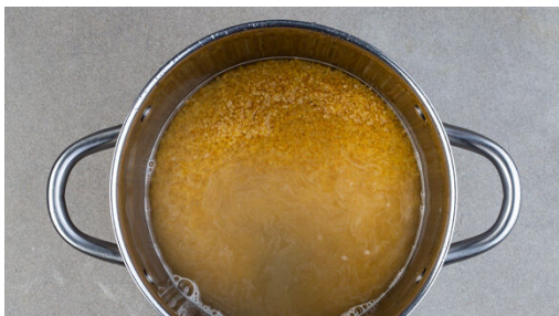
1. Bulgur kochen

Energie 850kcal, Fett 34.4g, Kohlenhydrate 108.5g, Eiweiß 20.4g