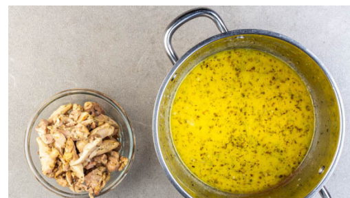
2. Fleisch anbraten

Den Blumenkohl im Milchtopf zu einer Sauce pürieren. Den Spinat portionsweise hinzugeben und bei mittlerer bis hoher Hitze 4-6Min. köcheln, bis er zusammenfällt, dabei gelegentlich umrühren. Tipp: Wenn die Sauce am Boden anhaftet, etwas Wasser hinzugeben. Vom Herd nehmen und mit Salz und Pfeffer abschmecken.