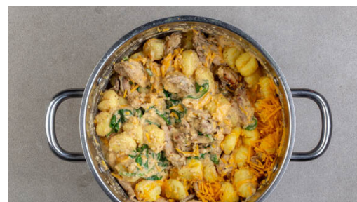
5. Gnocchi kochen

In einem zweiten großen Topf das Fleisch mit 100g Butter bei mittlerer Hitze 4-5Min. anbraten, dann aus dem Topf nehmen. Den Knoblauch in den Topf geben und unter die geschmolzene Butter rühren, dann 400ml Milch und 1TL Salz einrühren und vom Herd nehmen.