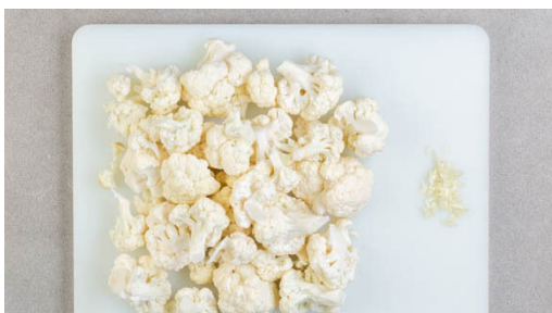
1. Blumenkohl schneiden

Energie 963kcal, Fett 42.9g, Kohlenhydrate 90.5g, Eiweiß 52.0g