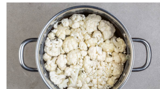
3. Blumenkohl kochen

Die Gnocchi in das kochende Wasser geben und 2-3Min. kochen lassen, bis sie gar sind und an der Oberfläche schwimmen. In ein Sieb abgießen, abtropfen lassen und mit der ½ des Käses und dem Fleisch unter die Blumenkohlsauce rühren.