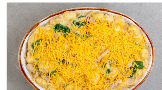
6. Auflauf backen

Den Blumenkohl in das kochende Wasser geben und 7-9Min. kochen, bis er sehr weich ist. Mit einer Schaumkelle aus dem Wasser heben und in den Topf mit der Milch geben. Den Topf mit dem Wasser auf dem Herd lassen.