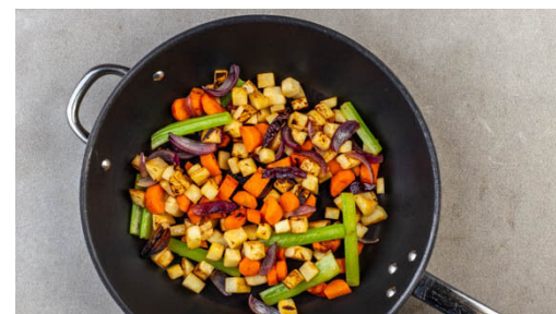
2. Gemüse braten

Die Petersilie samt Stängeln grob hacken. Den Knoblauch schälen und grob würfeln. Die Petersilie und den Knoblauch mit 4EL Olivenöl in einem hohen Gefäß pürieren. Mit Salz und Pfeffer abschmecken und ggf. etwas Wasser bis zur gewünschten Konsistenz unterrühren.