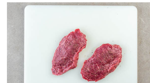
3. Steaks würzen

Das Basilikum möglichst fein schneiden und mit den Zwiebelwürfeln in das Chimichurri mischen.