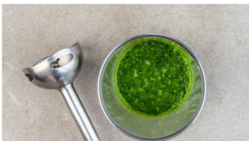
4. Chimichurri vorbereiten

Den Knollensellerie schälen und in 1-2cm große Stücke schneiden. Die Karotten ggf. schälen und ebenfalls in 1-2cm große Stücke schneiden. Den Stangensellerie breite Streifen schneiden. Die Zwiebeln schälen und halbieren, eine Hälfte in ca. 1cm dicke Spalten schneiden, die andere Hälfte fein würfeln.