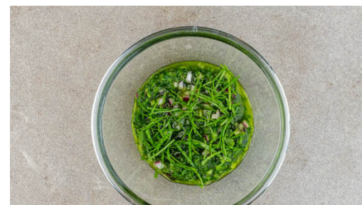
5. Chimichurri fertigstellen

Den Sellerie , die Karotten und die Zwiebelspalten in einer großen Pfanne mit 2EL Olivenöl bei mittlerer Hitze 12-15Min. braten. Zwischendurch mit 2-3EL Wasser ablöschen und verdampfen lassen, bis das Gemüse deutliche Röstspuren hat und bissfest gegart ist. Mit Salz und Pfeffer abschmecken.