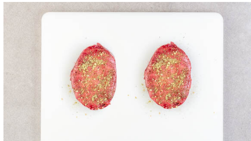
4. Steaks würzen

Die Kartoffeln je nach Größe halbieren oder vierteln und in einem mittelgroßen Topf mit stark gesalzenem Wasser bedecken. Das Wasser zum Kochen bringen und die Kartoffeln 15-20Min. kochen, bis sie bissfest sind. In ein Sieb abgießen.