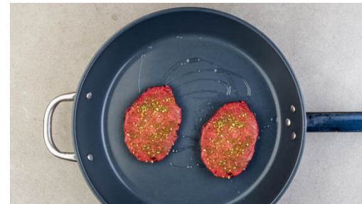
5. Steaks braten

Inzwischen den Salat der Länge nach in grobe Streifen schneiden. Die Lauchzwiebeln in sehr feine Ringe schneiden.