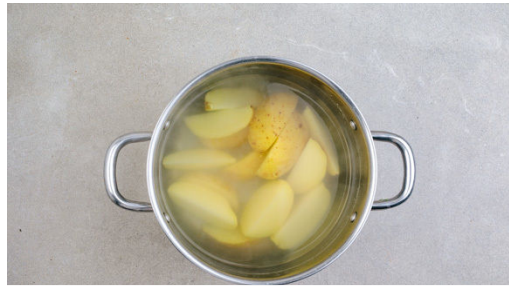
1. Kartoffeln kochen

Energie 667kcal, Fett 35.5g, Kohlenhydrate 52.1g, Eiweiß 29.4g