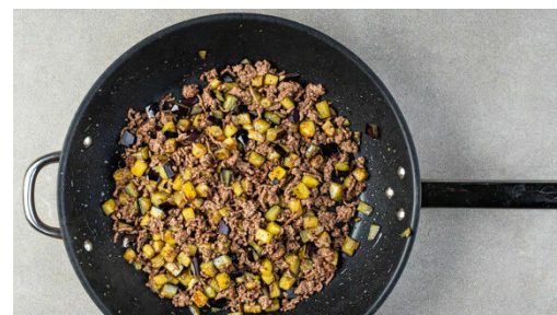
2. Hackfleisch braten

Die Gnocchi in einer zweiten großen Pfanne mit 2EL Olivenöl bei mittlerer bis starker Hitze 6-8Min. braten, dabei ab und zu umrühren. Mit je 1 kräftigen Prise Salz und Pfeffer würzen.