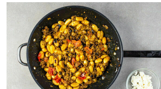
6. Fertigstellen & servieren

Die Tomaten , das Ras el-Hanout sowie 5-6EL Wasser in die Pfanne geben und bei mittlerer Hitze 14-16Min. köcheln lassen, bis das Gemüse gar ist. Bei Bedarf etwas mehr Wasser zugeben.