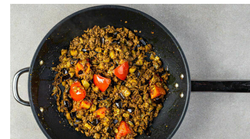
3. Sauce köcheln

Die 1/2 des Fetas mit dem Knoblauch , dem Basilikum samt Stängeln und 2TL hellem Essig in einem hohen Gefäß zu einem cremigen Pesto pürieren. Die Za'atar-Gewürzmischung , 3EL Olivenöl sowie 2EL Wasser unterrühren und das Pesto mit Salz und Pfeffer sowie ggf. mehr Essig abschmecken.