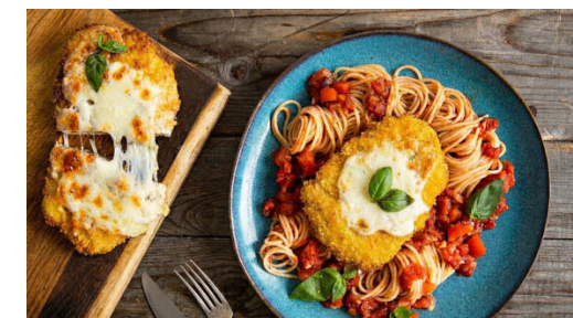
6. Anrichten & servieren

Die Pasta in das kochende Wasser geben und in 7-9Min. bissfest kochen. In ein Sieb abgießen und abtropfen lassen.