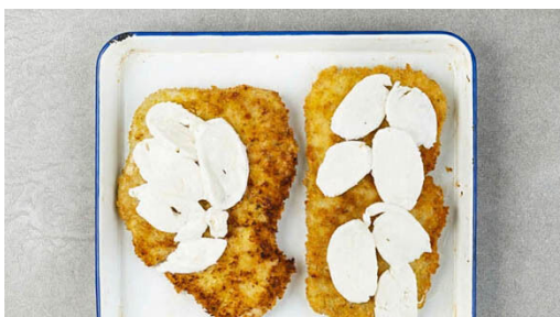
4. Schnitzel überbacken

Den Backofen mit Grillfunktion oder Ober-/Unterhitze auf 220°C vorheizen. In einem mittelgroßen Topf ausreichend gesalzenes Wasser für die Pasta zum Kochen bringen. Die Tomaten in kleine Würfel schneiden. Die Zwiebel und den Knoblauch schälen und fein würfeln.