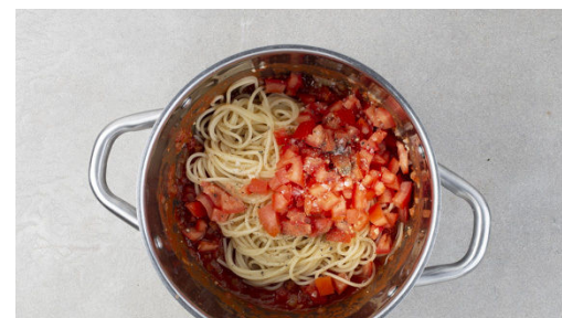
5. Pasta fertigstellen

In einem zweiten mittelgroßen Topf die Zwiebeln mit 1EL Olivenöl bei mittlerer Hitze 1-2Min. farblos anbraten. Den Knoblauch dazugeben und mit den gehackten Tomaten ablöschen. Die Sauce mit je ½TL Salz und Zucker sowie 1 Prise Pfeffer würzen und ca. 5Min. abgedeckt köcheln lassen, dann noch ca. 5Min. ohne Deckel einköcheln.