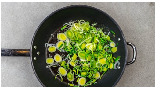
1. Lauch anbraten

Energie 832kcal, Fett 36.8g, Kohlenhydrate 92.0g, Eiweiß 27.4g