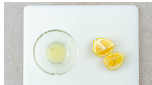
2. Zitrone vorbereiten

Inzwischen den Lauch mit ½TL Zitronensaft ablöschen. Die Kirschtomaten , die Auberginen-Oliven-Sauce und 150ml Wasser in die Pfanne geben und bei niedriger bis mittlerer Hitze unter gelegentlichem Rühren bis zum Ende der Kochzeit der Pasta köcheln lassen.