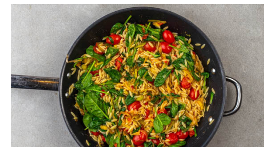
6. Spinat hinzugeben

Die Pasta in das kochende Wasser geben und in 10-12Min. bissfest kochen. In ein Sieb abgießen und abtropfen lassen.