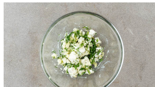
5. Feta vorbereiten

Inzwischen die Zitrone halbieren und eine Hälfte auspressen, die andere Hälfte in 2 Spalten schneiden.