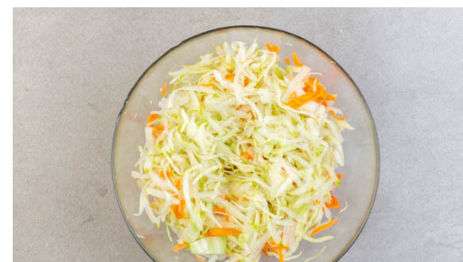
2. Salat fertigstellen

Den Tofu vorsichtig mit etwas Küchenpapier ausdrücken, dann in 4 Scheiben schneiden. Die Tofuscheiben in einer mittelgroßen Pfanne mit 2EL Pflanzenöl bei starker Hitze 4-5Min. von beiden Seiten anbraten, bis sie goldbraun sind.