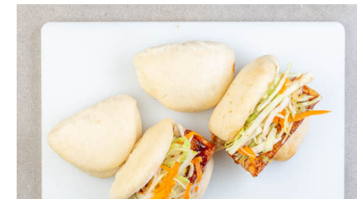
6. Hefebrötchen füllen

Den Dampfbhälter mit Backpapier auslegen, die Hefebrötchen hineingeben und ca. 7Min. abgedeckt dämpfen, bis sie weich und fluffig sind. Vorsicht , heißer Dampf! Tipp: Die Brötchen nach dem Dämpfen mit einem Handtuch abdecken, damit sie feucht und warm bleiben.