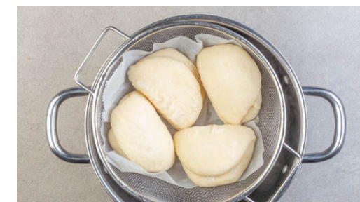
3. Hefebrötchen dämpfen

Die Pfanne vom Herd nehmen, die Hoisinsauce und die Würzsauce zugeben und die Tofuscheiben darin wenden.