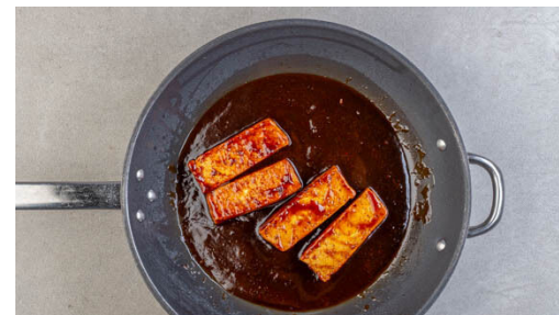
5. Tofu verfeinern

Die Birne samt Schale grob raspeln, dabei das Kerngehäuse aussparen. Die Birnenraspel mit dem Weißkohl-Karotten-Mix vermengen.