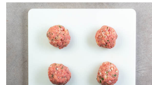
3. Bouletten vorbereiten

Die Pilze in derselben Pfanne mit 2EL Pflanzenöl bei starker Hitze 3-4Min. scharf anbraten. Die Zwiebelstreifen dazugeben und 1-2Min. mitbraten. Mit je 1 kräftigen Prise Salz und Pfeffer würzen und die restliche Petersilie untermischen.