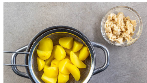
2. Kartoffeln kochen

Die Bouletten in einer großen Pfanne mit 1½EL Pflanzenöl bei mittlerer Hitze auf jeder Seite 5-7Min. braten, bis das Fleisch durch ist. Dann aus der Pfanne nehmen und auf einem Teller abgedeckt warm halten.