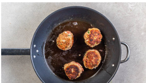
4. Bouletten braten

In einem mittelgroßen Topf ausreichend leicht gesalzenes Wasser für die Kartoffeln zum Kochen bringen. Die Pilze ggf. säubern und vierteln. Die Zwiebel schälen, halbieren und eine Hälfte in Würfel, die andere Hälfte in dünne Streifen schneiden. Die Petersilie samt Stängeln fein hacken.