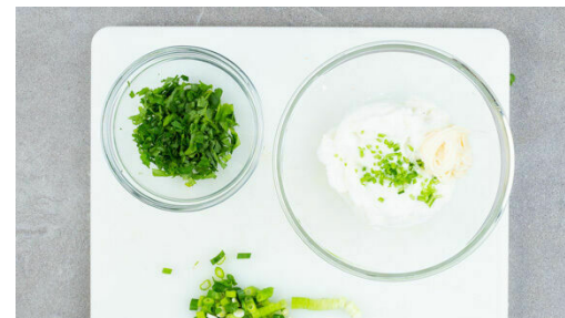
5. Korianderjoghurt anrühren

Die Peperoni in feine Ringe schneiden. Tipp: Für weniger Schärfe die Kerne entfernen. Die Limetten halbieren und auspressen. Den Limettensaft mit 1EL Wasser, 1½TL Zucker, 1 kräftigen Prise Salz und den Peperoniringen nach Geschmack zu einem Dressing verrühren. Die übrige Karotte grob raspeln, mit dem Dressing vermengen und ziehen lassen.