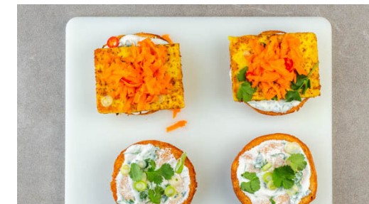
6. Belegen und servieren

Den Grillkäse trocken tupfen, jeweils horizontal halbieren und mit der Gewürzmischung einreiben.