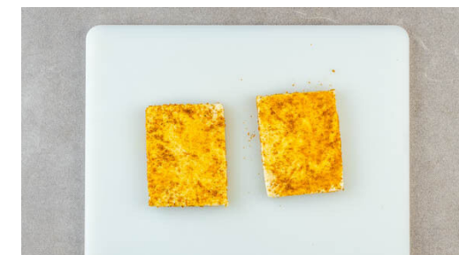
3. Grillkäse vorbereiten

Die Korianderblättchen von den Stängeln zupfen und grob schneiden. Die Korianderstängel fein hacken und mit dem Joghurt , 4EL Mayonnaise und 1 kräftigen Prise Salz verrühren. Die Lauchzwiebeln in feine Ringe schneiden.