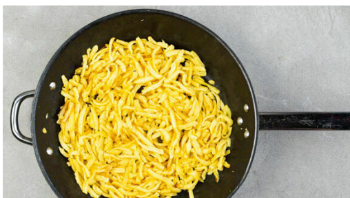
4. Spätzle anbraten

Parallel in einer zweiten Pfanne das Hackfleisch mit 1EL Olivenöl bei mittlerer bis starker Hitze 5Min. knusprig anbraten.