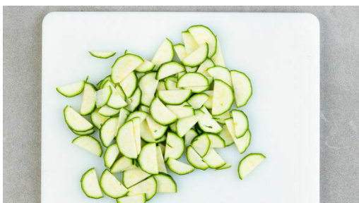
1. Zucchini schneiden

Energie 1012kcal, Fett 66.3g, Kohlenhydrate 62.6g, Eiweiß 39.3g