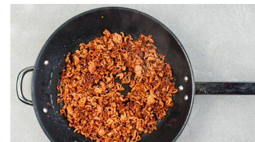
3. Hackfleisch braten

Die Zucchini in einer großen Pfanne mit 2EL Olivenöl bei mittlerer bis starker Hitze ca. 5Min. goldbraun anbraten, dabei regelmäßig umrühren, damit die Zucchinischeiben gleichmäßig garen und bräunen.