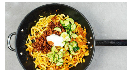
6. Spätzle fertigstellen

Das Pesto zu den Spätzle in die Pfanne geben, die Pestobecher mit etwas warmem Wasser ausschwenken und das Wasser ebenfalls zu den Spätzle in die Pfanne geben. Alles gut vermengen und 1-2Min. durchwärmen.