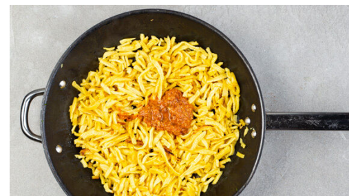
5. Pesto zugeben

Die Zucchini mit 1 Prise Salz würzen und zum Hackfleisch in die Pfanne geben. Die Pfanne ggf. auswischen, dann die Spätzle in der Pfanne mit 1EL Olivenöl bei mittlerer Hitze 5-8Min. anbraten, bis die Spätzle leicht gebräunt sind.