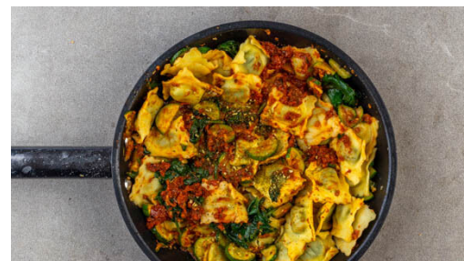
5. Pasta vermengen

Die Zucchini in einer mittelgroßen Pfanne mit 1EL Butter und 1 kräftigen Prise Salz bei mittlerer bis starker Hitze in 4-6Min. goldbraun anbraten.