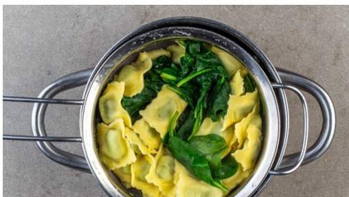
4. Pasta und Spinat kochen

In einem mittelgroßen Topf ausreichend gesalzenes Wasser für die Pasta zum Kochen bringen. Die Zucchini längs halbieren und quer in ca. 0,5cm dünne Scheiben schneiden.