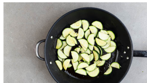
2. Zucchini braten

Die Pasta in das kochende Wasser geben und in ca. 3Min. bissfest kochen. Den Spinat in den Topf zu der Pasta geben und für die letzten ca. 30Sek. mitkochen. Die Pasta und den Spinat in ein Sieb abgießen und abtropfen lassen.