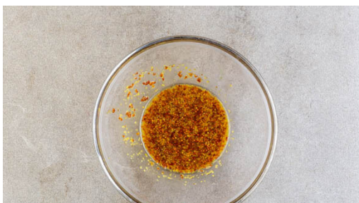
1. Marinade zubereiten

Energie 723kcal, Fett 30.4g, Kohlenhydrate 70.0g, Eiweiß 42.4g