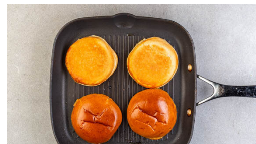
5. Burgerbrötchen rösten

Ggf. eine Grillpfanne bei mittlerer bis starker Hitze erwärmen. Die Nektarine in Spalten schneiden, dabei den Stein entfernen. Die Nektarinenspalten mit ½EL Olivenöl und ¼EL Honig vermengen, dann von beiden Seiten ca. 30Sek. grillen, bis sich deutliche Röstspuren abzeichnen. Die Nektarinen zum Coleslaw geben.