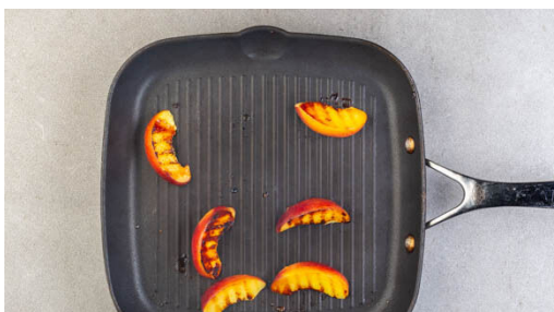
4. Nektarine grillen

1½EL Mayonnaise, 1EL Olivenöl, 1EL Essig, ½TL Salz sowie je 1 kräftige Prise Paprikapulver und Pfeffer verrühren. Die ½ des Weißkohls in dünne Streifen schneiden, dabei den Strunk entfernen. Die Zwiebel schälen, halbieren und in feine Streifen schneiden. Den Weißkohl und die Zwiebeln mit dem Dressing vermengen. Mit Salz, Pfeffer und ggf. mehr Paprikapulver abschmecken.