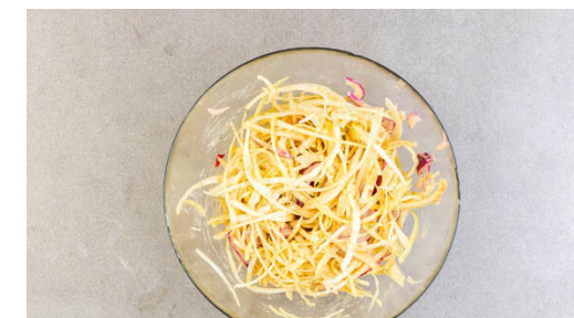
3. Coleslaw zubereiten

Das Fleisch trocken tupfen, horizontal halbieren und mit der Marinade vermengen.