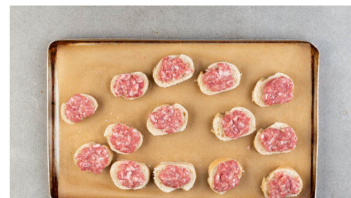
2. Crostini backen

Den Thymian in einem großen Topf mit 2EL Olivenöl stark erhitzen. Das Gemüsepüree zugeben und 2-3Min. braten. 200ml Wasser angießen, die Tomaten , das Brühgewürz und 1TL Zucker untermengen und abgedeckt 5-7Min. köcheln lassen.