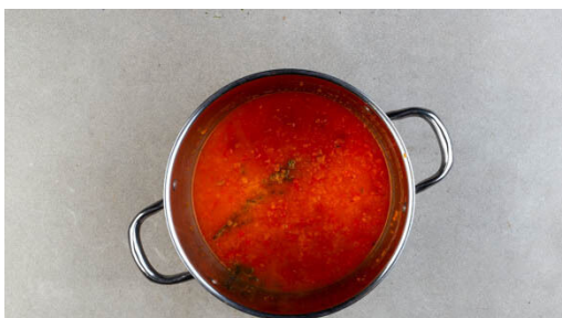
4. Suppe kochen

Den Backofen mit Grillfunktion oder Ober-/Unterhitze auf 250°C vorheizen. Die Zwiebeln schälen, halbieren und grob würfeln. Die Paprika vierteln, entkernen und grob würfeln.