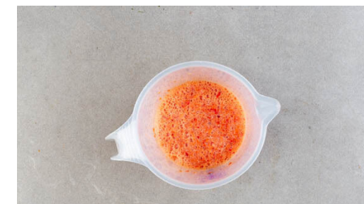
3. Gemüse pürieren

Die Basilikumblätter abzupfen, die Stängel fein schneiden und zur Suppe in den Topf geben.