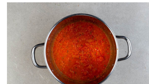
6. Suppe fertigstellen

Die Zwiebeln und die Paprika mit 100ml Wasser in einem hohen Gefäß fein pürieren.