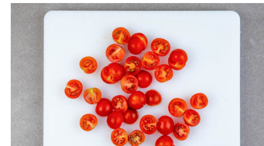
3. Tomaten schneiden

Die Pasta mit dem Pesto und Pastawasser vermengen, nach Bedarf noch etwas mehr Wasser hinzufügen.