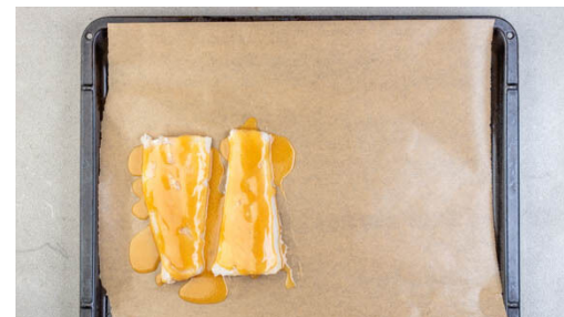
2. Fisch vorbereiten

Den Fisch und den Brokkoli 5-6Min. im Ofen backen, bis der Fisch gar ist, dann den Fisch aus dem Ofen nehmen. Den Brokkoli wenden und 5-6Min. weiterbacken, bis die Ränder Röstmarken bekommen und knusprig sind. Inzwischen den Knoblauch schälen und sehr fein würfeln oder durch eine Knoblauchpresse drücken.