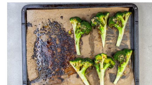
6. Brokkoli verfeinern

Den Brokkolistrunk ggf. von harten Stellen befreien. Dann den Brokkoli halbieren und vom Strunk aus in insgesamt 12 Spalten schneiden. Den Brokkoli auf ein zweites mit Backpapier ausgelegtes Backblech geben und mit 2EL Pflanzenöl sowie je ½TL Salz und Pfeffer vermengen.