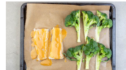
3. Brokkoli vorbereiten

Den weißen Teil und den grünen Teil der Lauchzwiebeln getrennt in feine Ringe schneiden. 4EL Butter in dem Topf bei niedriger bis mittlerer Hitze schmelzen. Den Knoblauch , die weißen Lauchzwiebelringe und 2TL Sesam unterrühren. Den Topf vom Herd nehmen und die restliche Misopaste , das restliche Sesamöl , 2EL Honig und 4EL Essig unterrühren.