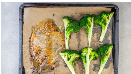
4. Fisch & Brokkoli backen

Den Backofen auf 220°C (200°C Umluft) vorheizen. In einem mittelgroßen Topf 600ml leicht gesalzenes Wasser zum Kochen bringen. Den Reis in einem Sieb kalt abspülen, bis das Wasser klar bleibt. Sobald das Wasser kocht, den Reis hineingeben und abgedeckt bei niedrigster Hitze 10-12Min. kochen, bis das Wasser aufgesogen und der Reis gar ist. Noch ca. 5Min. ohne Hitzezufuhr ziehen lassen.