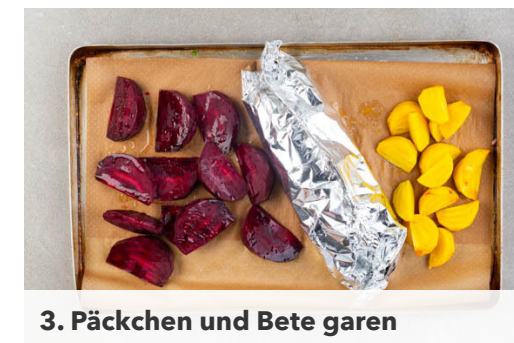
3. Päckchen und Bete garen

Die ½ des Basilikums samt Stängeln grob schneiden und mit dem restlichen Spinat , 2EL Olivenöl, 2TL Essig, 2TL Senf und ½TL Salz in einem hohen Gefäß mit einem Stabmixer möglichst fein pürieren. Ggf. löffelweise Wasser hinzufügen, falls das Dressing zu dickflüssig ist.