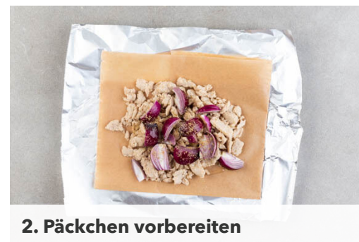
2. Päckchen vorbereiten

Den Perlencouscous und die Datteln in das kochende Wasser rühren und abgedeckt bei mittlerer Hitze 8-10Min. sanft köcheln lassen, bis das Wasser aufgesaugt und der Perlencouscous gar ist. In der letzten Minute der Garzeit die ½ des Spinats unterheben, dann mit 2EL Olivenöl und je 1 kräftigen Prise Salz und Pfeffer würzen. Tipp: Der Spinat muss nicht ganz zusammenfallen.