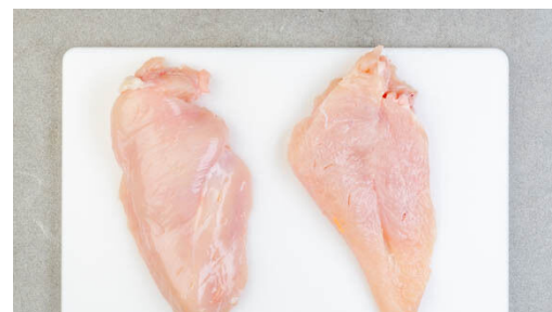
2. Fleisch schneiden

Die ½ der Estragonblätter abzupfen, fein schneiden und mit 6EL Mayonnaise und der Zitronenschale verrühren. Die übrigen Estragonblätter abzupfen und beiseitestellen.