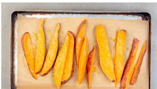
1. Süßkartoffeln backen

Energie 679kcal, Fett 35.0g, Kohlenhydrate 52.7g, Eiweiß 36.3g