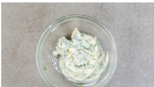
4. Mayo verfeinern

Den Backofen auf 220°C (200°C Umluft) vorheizen. Die Süßkartoffeln in Spalten schneiden und auf ein mit Backpapier ausgelegtes Backblech geben. Mit 1EL Olivenöl und ½TL Salz vermengen und 20-25Min. im Ofen backen. Nach der Hälfte der Backzeit wenden.