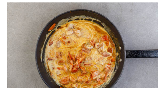
6. Fertigstellen & servieren

Die Mandelblättchen in einer großen Pfanne ohne Zugabe von Fett bei mittlerer Hitze 1-2Min. goldbraun anrösten. Vorsicht , sie können schnell zu dunkel werden. Zum Abkühlen aus der Pfanne nehmen und beiseitestellen.