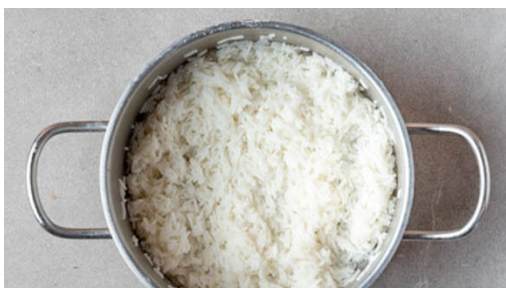
1. Reis kochen

Energie 710kcal, Fett 24.8g, Kohlenhydrate 74.9g, Eiweiß 42.7g