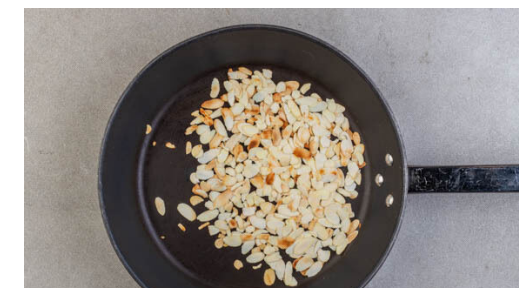
3. Mandeln anrösten

In derselben Pfanne die Karotten , die Tomaten und den Knoblauch bei mittlerer Hitze ca. 2Min. anbraten. Mit je 1 kräftigen Prise Salz und Pfeffer würzen und 2EL Currypaste sowie 150ml Wasser zufügen. Einmal aufkochen, das Fleisch zurück in die Pfanne geben und in ca. 5Min. gar köcheln. Wenn das Fleisch gar ist, die Pfanne vom Herd nehmen und 1-2Min. abkühlen lassen.