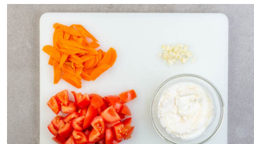
2. Zutaten vorbereiten

Das Fleisch trocken tupfen und jeweils horizontal halbieren. Mit je 1 Prise Salz und Pfeffer würzen und mit der ½ der Currypaste einreiben. Das Fleisch in der Pfanne mit 2EL Pflanzenöl bei starker Hitze von jeder Seite 2-3Min. goldbraun anbraten. Aus der Pfanne nehmen und beiseitestellen.