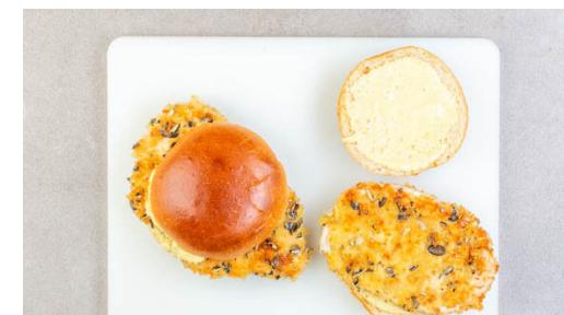
6. Burger belegen

Für den Dip den Joghurt mit 3EL Mayonnaise und ca. \frac{2}{3} des Currypulvers verrühren und mit Salz und Pfeffer abschmecken.