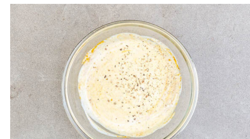
3. Dip zubereiten

Die Schnitzel in einer großen Pfanne mit 3EL Olivenöl bei mittlerer Hitze auf jeder Seite 3-4Min. braten, bis die Panade goldgelb und knusprig ist. Tipp: Wenn die Pfanne nicht groß genug ist, die Schnitzel in zwei Durchgängen braten und zwischendurch etwas mehr Öl hinzugeben oder eine zweite Pfanne verwenden.