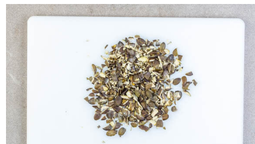
2. Kürbiskerne hacken

Das Fleisch trocken tupfen, jeweils horizontal halbieren und mit dem Boden einer schweren Pfanne oder einem Fleischklopper flach klopfen. Die Kürbiskerne mit dem Panko-Paniermehl vermengen. 1 Ei mit 1-2EL Wasser verquirlen. Die Schnitzel mit je 1 Prise Salz, Pfeffer und Currypulver würzen und nacheinander in 4EL Mehl, dem Ei und dem Kürbiskern-Panko-Mix wenden.