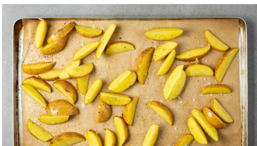
1. Kartoffeln backen

Energie 900kcal, Fett 38.7g, Kohlenhydrate 92.6g, Eiweiß 44.1g