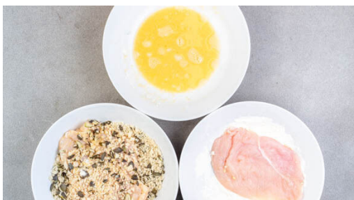
4. Fleisch panieren

Den Backofen auf 220°C (200°C Umluft) vorheizen. Die Kartoffeln samt Schale in ca. 1cm breite Spalten schneiden und mit 2EL Olivenöl sowie je 1 kräftigen Prise Salz und Pfeffer vermengen. Auf einem mit Backpapier ausgelegten Backblech verteilen und 20-25Min. im Ofen backen, bis die Kartoffeln goldbraun und gar sind.