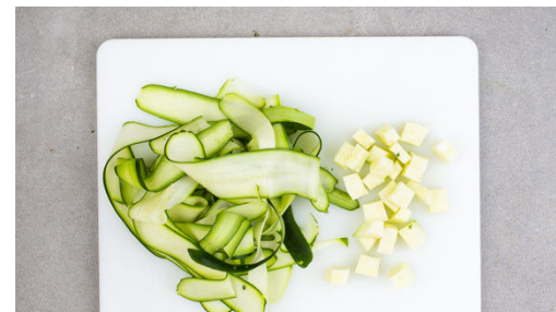
2. Zucchini vorbereiten

Die abgetropften Kichererbsen in der Pfanne mit 2TL Olivenöl bei starker Hitze in 4-5Min. knusprig und goldbraun braten. Mit Salz und Pfeffer nach Geschmack würzen.