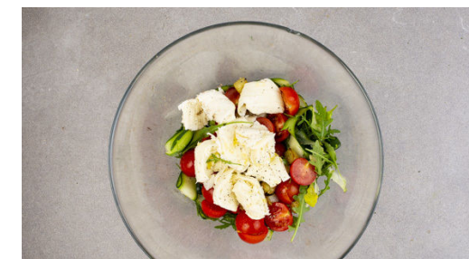
6. Salat fertigstellen

Die Zucchiniwürfel in der Pfanne mit 1TL Olivenöl bei mittlerer Hitze 3-4Min. goldbraun anbraten. Währenddessen die Kirschtomaten halbieren. Die Zucchiniwürfel aus der Pfanne nehmen und beiseitestellen. Nach Belieben mit Salz und Pfeffer würzen.