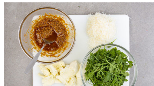
5. Pesto zubereiten

Die Zucchini mit einem Sparschäler oder einem Gemüsehobel rundum in breite Streifen schneiden. Das Kerngehäuse in kleine Würfel schneiden.