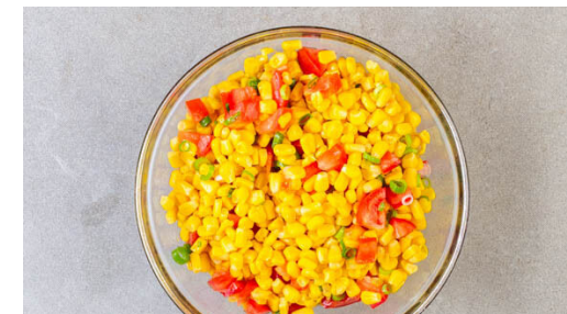
3. Salsa vorbereiten

Die Kokosraspel in einer mittelgroßen Pfanne ohne Zugabe von Fett bei mittlerer Hitze 1-2Min. goldbraun anrösten, dann unter den Reis heben. Die übrigen Lauchzwiebeln in feine Ringe schneiden.