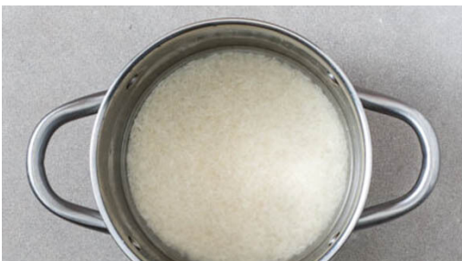
1. Reis kochen

Energie 700kcal, Fett 21.3g, Kohlenhydrate 79.4g, Eiweiß 41.2g