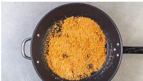
5. Kokosreis zubereiten

Die Gewürzmischung mit 2EL Olivenöl und je 1 kräftigen Prise Salz und Pfeffer verrühren. Das Fleisch mit etwas Küchenkrepp trocken tupfen und mit dem Gewürzöl vermengen, dann auf ein mit Backpapier ausgelegtes Blech (oder in eine große Auflaufform) geben und im Ofen in 20-25Min. gar backen.