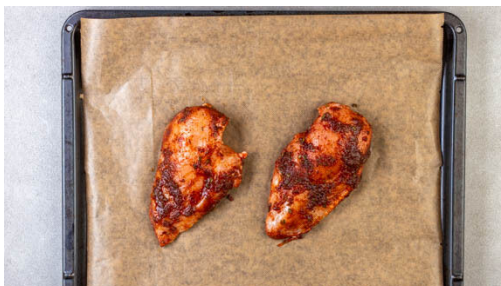
2. Fleisch backen

In einem kleinen Topf 2EL Butter bei mittlerer Hitze schmelzen, dann 1EL Mehl einrühren. Nach und nach 500ml Wasser, das Brühwürz und ggf. die Bratensäfte vom Blech oder aus der Auflaufform zugeben und köcheln, bis eine sämige Sauce entsteht.