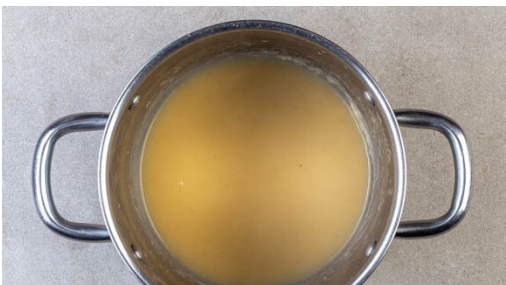
4. Sauce köcheln

Den Backofen auf 220°C (200°C Umluft) vorheizen. In einem großen Topf 1,2L leicht gesalzenes Wasser zum Kochen bringen. Den Reis in einem Sieb kalt abspülen, bis das Wasser klar bleibt, dann in das kochende Wasser geben und abgedeckt bei niedrigster Hitze 10-12Min. kochen, bis das Wasser aufgesogen und der Reis gar ist. Noch ca. 5Min. ohne Hitzezufuhr ziehen lassen.