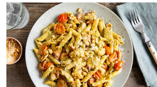
6. Anrichten und servieren

Die Tomaten halbieren. Die Pasta in das kochende Wasser geben und in 7-9Min. bissfest kochen. Mit einem Messbecher ca. 150ml Pastawasser abschöpfen, dann die Pasta in ein Sieb abgießen, zurück in den Topf geben und warm halten.