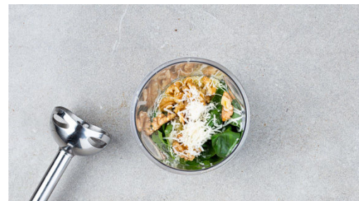
2. Pesto zubereiten

Das „ Hähnchen “ in der Pfanne mit 2EL Olivenöl bei starker Hitze 2-3Min. scharf anbraten. Dann die Tomaten dazugeben und 1-2Min. bei mittlerer Hitze mitbraten. Mit Salz und Pfeffer abschmecken.