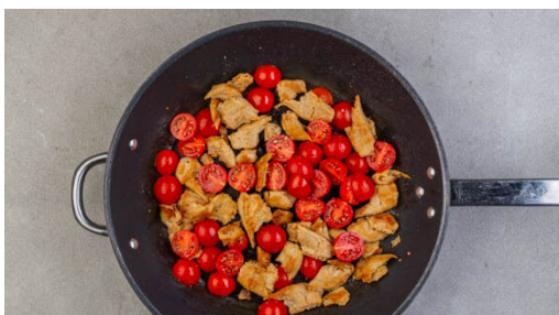
4. „Hähnchen“ braten

In einem großen Topf ausreichend gesalzenes Wasser für die Pasta zum Kochen bringen. Die Walnüsse in einer großen Pfanne bei mittlerer Hitze ohne Zugabe von Fett 1-2Min. anrösten. Vorsicht , sie können schnell zu dunkel werden. Zum Abkühlen auf einem Teller beiseitestellen, die Pfanne aufbewahren.