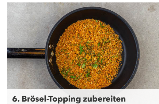
6. Brösel-Topping zubereiten

1EL Butter in einem kleinen Topf bei mittlerer Hitze schmelzen und die Schalotten in der Butter ca. 2Min. sanft anbraten. 1EL Mehl unterrühren, dann langsam 300ml Milch mit einem Schneebesen klümpchenfrei einrühren. Die ½ des Brühgewürzes und 1TL Senf zugeben und die Sauce unter ständigem Rühren 3-5Min. sämig einkochen. Vom Herd nehmen und den Hartkäse unterrühren.