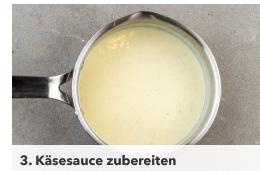
3. Käsesauce zubereiten

Den Knoblauch schälen und fein würfeln. Die Zitrone halbieren und von einer Hälfte die Zitronenschale abreiben, dann in 2 Spalten schneiden. Die übrige Zitronenhälfte für ein anderes Rezept aufbewahren. Die ½ des Basilikums oder mehr fein schneiden.