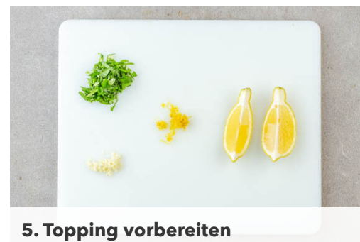
5. Topping vorbereiten

Die Pasta in das kochende Wasser geben und 4-5Min. kochen, dann den Brokkoli hinzugeben und 3-4Min. weiterkochen, bis die Pasta bissfest und der Brokkoli gar ist. Den Spinat in ein Sieb geben und die Pasta auf den Spinat abgießen und abtropfen lassen. Die Pasta und das Gemüse zurück in den Topf geben.