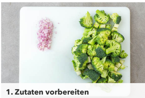
1. Zutaten vorbereiten

Energie 892kcal, Fett 32.3g, Kohlenhydrate 100.5g, Eiweiß 41.5g