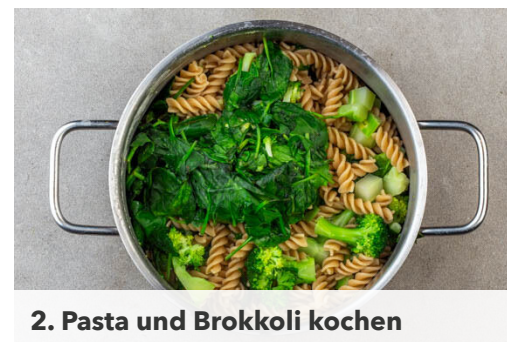
2. Pasta und Brokkoli kochen

Die Käsesauce und die ½ des Cheddars im Topf mit der Pasta und dem Gemüse vermengen. Probieren und ggf. mit Salz und Pfeffer nachwürzen. Die Pastamischung in eine große Auflaufform geben, mit dem restlichen Cheddar bestreuen und in 10-12Min. goldbraun überbacken.