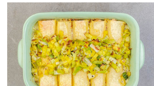
6. Cannelloni backen

2EL Butter in einem mittelgroßen Topf bei mittlerer Hitze erwärmen. Den Lauch hinzugeben und 2-3Min. anschwitzen, bis er weich wird. Dann mit 3-4EL Wasser ablöschen, vom Herd nehmen und mit der restlichen Gewürzmischung sowie je 1 kräftigen Prise Salz und Pfeffer würzen.