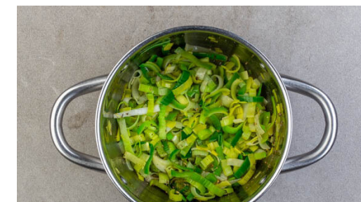
3. Lauch anschwitzen

Die Lasagneblätter jeweils entlang einer der Längsseiten mit 3-4EL Thunfisch-Bohnen-Füllung belegen und die Füllung verstreichen, sodass sie etwa ¾ des Lasagneblatts bedeckt. Die Lasagneblätter ausgehend von der Längsseite mit Füllung Richtung Längsseite ohne Füllung zu Cannelloni aufrollen und in die Auflaufform legen.