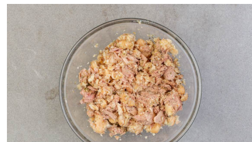
2. Füllung zubereiten

Die Kochsahne , 3EL körnigen Senf und 1 kräftige Prise Salz unter den Lauch rühren. Ca. ¾ der Lauchcreme gleichmäßig in einer mittelgroßen Auflaufform verteilen, die übrige Lauchcreme für die Cannelloni aufbewahren.