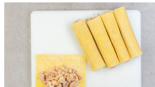
5. Cannelloni füllen

Die Bohnen mit einer Gabel leicht zerdrücken, dann mit dem Thunfisch , der ½ der Gewürzmischung sowie je 1 kräftigen Prise Salz und Pfeffer vermengen.