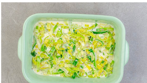
4. Lauchcreme zubereiten

Den Backofen auf 210°C (190°C Umluft) vorheizen. Den Lauch längs halbieren und in ca. 0,5cm breite Streifen schneiden. Die Bohnen in einem Sieb mit kaltem Wasser abspülen, abtropfen lassen und in eine Schüssel geben. Dann den Thunfisch im Sieb abtropfen lassen.