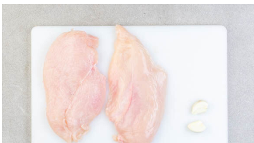
4. Fleisch vorbereiten

Den Backofen auf 220°C (200°C Umluft) vorheizen. Die Kartoffeln samt Schale in Spalten schneiden. Die Zucchini längs vierteln und quer in 2-3cm große Stücke schneiden. Die Karotte ggf. schälen, längs halbieren und quer in ca. 1cm dicke Scheiben schneiden.