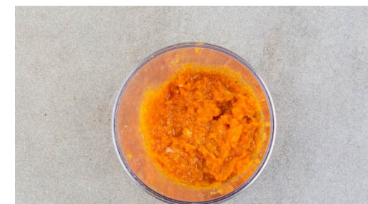
6. Fertigstellen & servieren

Die Kürbiskerne in einer mittelgroßen Pfanne ohne Zugabe von Fett bei mittlerer Hitze 2-4Min. anrösten, bis sie knistern und goldbraun sind. Zum Abkühlen aus der Pfanne nehmen. Die Pfanne aufbewahren.