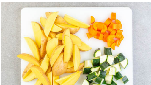
1. Gemüse schneiden

Energie 667kcal, Fett 33.2g, Kohlenhydrate 49.4g, Eiweiß 38.4g