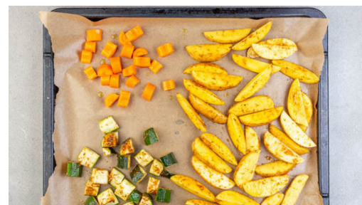
2. Gemüse rösten

Den Knoblauch schälen und halbieren. Das Fleisch mit etwas Küchenkrepp trocken tupfen, horizontal halbieren und mit je 1 Prise Salz und Pfeffer würzen.