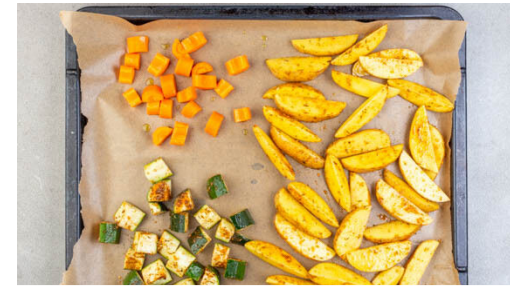
2. Gemüse rösten

Den Backofen auf 220°C (200°C Umluft) vorheizen. Die Kartoffeln samt Schale in Spalten schneiden. Die Zucchini längs vierteln und quer in 2-3cm große Stücke schneiden. Die Karotten ggf. schälen, längs halbieren und quer in ca. 1cm dicke Scheiben schneiden.