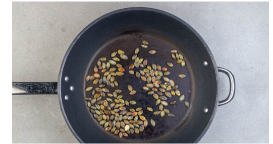
3. Kürbiskerne anrösten

Die Kartoffeln , die Zucchini und die Gewürzmischung auf einem mit Backpapier ausgelegten Blech mit 2EL Olivenöl und ½TL Salz vermengen. Die Karotten auf ein weiteres Blech geben, mit 1EL Olivenöl und 1 kräftigen Prise Salz vermengen. Alles ca. 15Min. im Ofen rösten, dann die Karotten aus dem Ofen nehmen. Das übrige Gemüse wenden und in weiteren 10-15Min. goldbraun backen.