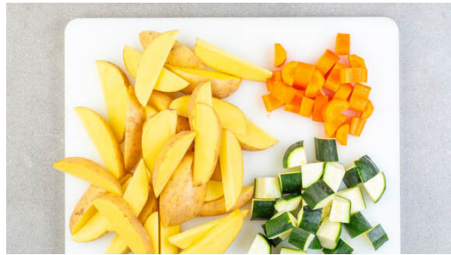
1. Gemüse schneiden

Energie 685kcal, Fett 33.3g, Kohlenhydrate 53.1g, Eiweiß 38.8g