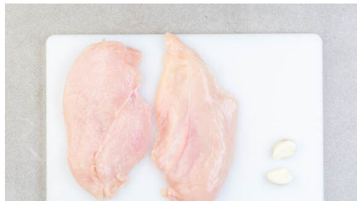
4. Fleisch vorbereiten

Die Kürbiskerne in einer großen Pfanne ohne Zugabe von Fett bei mittlerer Hitze 2-4Min. anrösten, bis sie knistern und goldbraun sind. Zum Abkühlen aus der Pfanne nehmen. Die Pfanne aufbewahren.