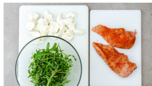
5. Zutaten vorbereiten

2EL Balsamicoessig und ½EL Honig verrühren. Die Karotten und den Fenchel mit jeweils der ½ der Balsamicoglasur vermengen, wieder gleichmäßig verteilen und ca. 5Min. weiterbacken, bis das Gemüse leicht karamellisiert ist.