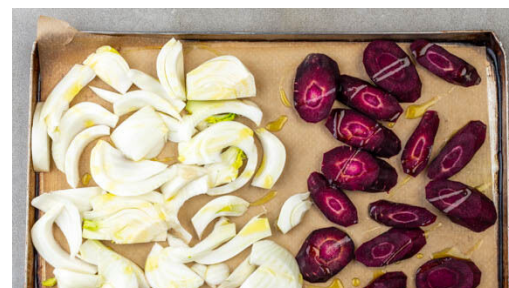
2. Gemüse backen

Den Backofen auf 240°C (220°C Umluft) vorheizen. Die Karotten ggf. schälen und schräg in 1-2cm breite Scheiben schneiden. Den Fenchel von den Stielen befreien, dann längs halbieren und der Länge nach in ca. 0,5cm breite Streifen schneiden.