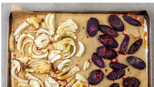
4. Gemüse glasieren

Inzwischen die Pistazienkerne mit 1EL Olivenöl in einem hohen Gefäß möglichst platt pürieren und mit je 1 Prise Salz und Pfeffer würzen.