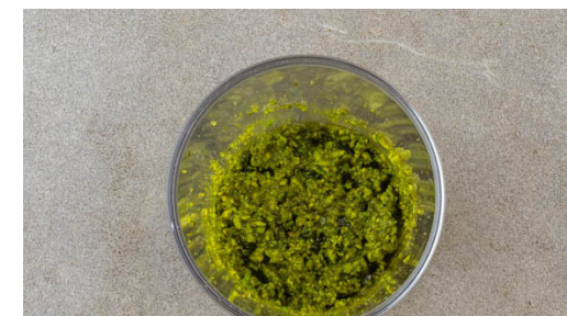
3. Pesto zubereiten

Die Karotten und den Fenchel auf ein mit Backpapier ausgelegtes Backblech geben und jeweils mit ½EL Olivenöl und je 1 Prise Salz und Pfeffer vermengen. Im Ofen 20-25Min. backen, bis das Gemüse gar ist.