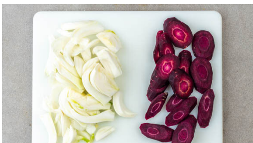
1. Gemüse schneiden

Energie 633kcal, Fett 42.8g, Kohlenhydrate 17.5g, Eiweiß 42.4g