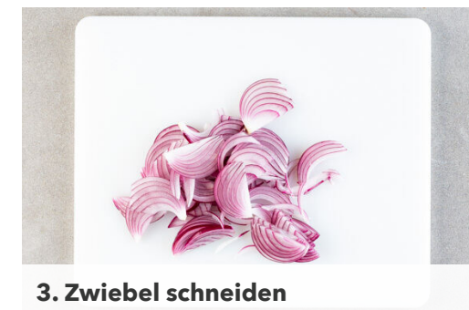
3. Zwiebel schneiden

Das Fleisch trocken tupfen und mit 1½EL Olivenöl einreiben. In einer Grillpfanne oder in einer großen Pfanne bei starker Hitze auf jeder Seite 2-3Min. anbraten. Währenddessen die Sauce probieren und evtl. mit Salz und Pfeffer nachwürzen.