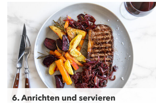
6. Anrichten und servieren

Die Zwiebel schälen, halbieren und in feine Streifen schneiden.