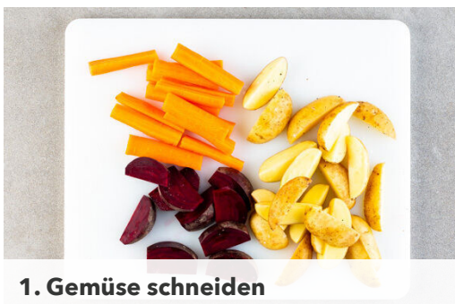
1. Gemüse schneiden

Energie 529kcal, Fett 15.8g, Kohlenhydrate 57.2g, Eiweiß 34.4g