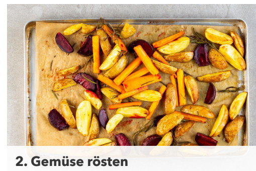
2. Gemüse rösten

Die Zwiebeln in einem kleinen Topf mit 2TL Olivenöl, 1TL Zucker und 1 kräftigen Prise Salz bei mittlerer Hitze ca. 2Min. anschwitzen. Mit 1TL Mehl bestäuben und ca. 30Sek. unterrühren, dann mit 2EL Balsamicoessig und 100ml Wasser ablöschen und die Sauce 7-8Min. sanft einkochen lassen.