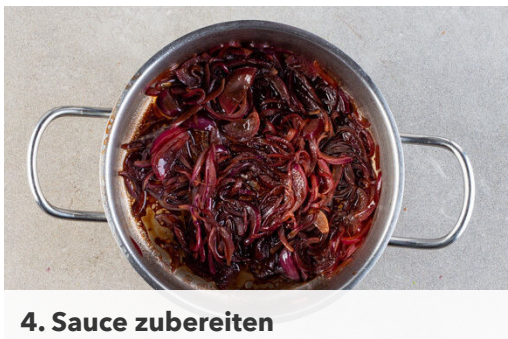
4. Sauce zubereiten

Den Backofen auf 230°C (210°C Umluft) vorheizen. 675g Kartoffeln samt Schale je nach Größe halbieren oder vierteln. Die Karotten ggf. schälen, längs vierteln und die Stifte dann quer halbieren. Die Rote Bete schälen und in ca. 1cm breite Spalten schneiden. Tipp: Da Rote Bete stark färbt, beim Verarbeiten am besten Küchenhandschuhe und Schürze tragen.