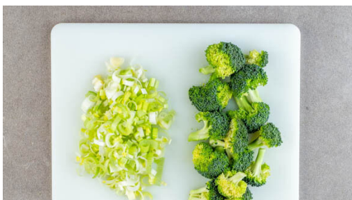
1. Gemüse schneiden

Energie 901kcal, Fett 37.2g, Kohlenhydrate 102.1g, Eiweiß 31.2g