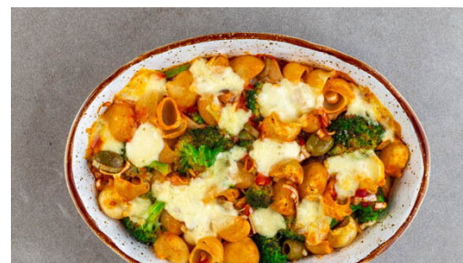
5. Auflauf backen

Den Lauch mit ½TL Salz in einer großen Pfanne mit 2EL Olivenöl bei mittlerer bis starker Hitze ca. 3Min. braten, bis er weich wird, dann auf mittlere Hitze reduzieren.