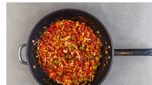
3. Sauce zubereiten

Die Pasta und den Brokkoli in einer großen Auflaufform verteilen. Mit der Sauce bedecken, mit 2EL Olivenöl beträufeln und großzügig mit Salz und Pfeffer würzen. Den Mozzarella in grobe Stücke zupfen und auf dem Auflauf verteilen. Ca. 10Min. im Ofen backen, bis der Mozzarella geschmolzen ist.