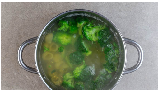
4. Pasta und Brokkoli kochen

Den Backofen auf 220°C (200°C Umluft) vorheizen. In einem großen Topf ausreichend gesalzenes Wasser für die Pasta zum Kochen bringen. Den Lauch längs halbieren und quer in feine Streifen schneiden. Den Brokkoli in mundgerechte Röschen zerteilen, den Strunk ggf. schälen und in ca. 0,5cm dünne Scheiben schneiden.