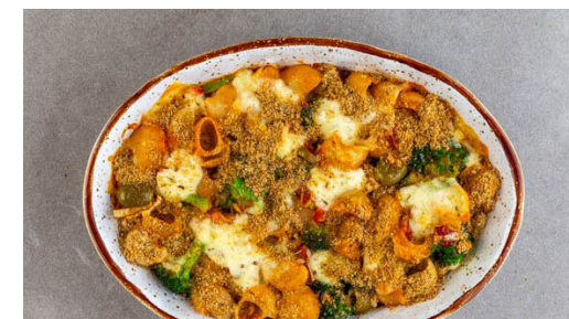
6. Auflauf verfeinern

Die Oliven , die passierten Tomaten und die Auberginen-Oliven-Sauce in die Pfanne geben und unterrühren. Die Sauce bei mittlerer Hitze ca. 5Min. sanft köcheln lassen. Vom Herd nehmen und mit Salz und Pfeffer abschmecken.