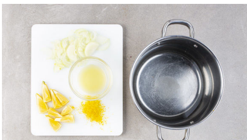
1. Zwiebel schneiden

Energie 846kcal, Fett 35.0g, Kohlenhydrate 89.5g, Eiweiß 41.3g