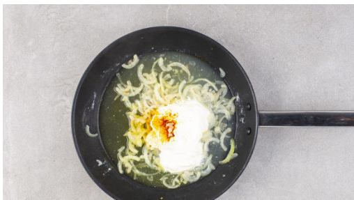
4. Sauce zubereiten

In einem mittelgroßen Topf ausreichend gesalzenes Wasser für die Pasta zum Kochen bringen. Die Zwiebel schälen, halbieren und in feine Streifen schneiden. Die Zitrone fein abreiben und die Zitrone halbieren, eine Hälfte auspressen, die andere Hälfte in Spalten schneiden.