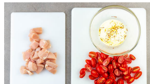
2. Zutaten vorbereiten

Die Zwiebeln in einer mittelgroßen Pfanne mit 1EL Olivenöl 1-2Min. farblos anschwitzen. Mit 1 gehäuften EL Mehl verrühren und mit 150-200ml Pastawasser ablöschen. Den Safran und die Crème fraîche unterrühren und die Sauce 3-4Min. sanft köcheln lassen. Noch etwas Wasser hinzufügen, sollte die Sauce zu stark eindicken. Mit Salz, Pfeffer und 1-2TL Zitronensaft abschmecken.