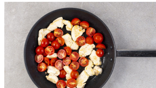
5. Fleisch braten

Den Safran mit einem Löffelrücken sanft zerdrücken, dann mit 1 Prise Salz und der ½ der Sahne verrühren. Das Fleisch trocken tupfen. Die Tomaten halbieren.