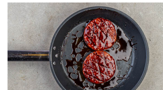
3. Pattys braten

Die Brötchen aufschneiden und auf einen Backrost geben. Die Backbleche und den Backrost in den Ofen schieben und alles ca. 2Min. backen, bis die Brötchen knusprig und die Süßkartoffeln weich sind.