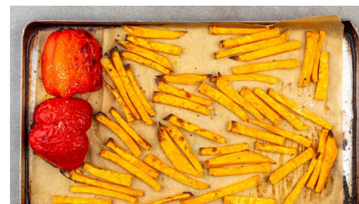
2. Gemüse rösten

Die Backbleche aus dem Ofen nehmen und die Süßkartoffeln und die Paprika mit \frac{3}{4} der Gewürzmischung vermengen.