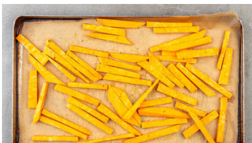
1. Süßkartoffeln schneiden

Energie 832kcal, Fett 45.5g, Kohlenhydrate 77.5g, Eiweiß 22.0g