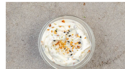
6. Dip zubereiten

Die veganen Rindfleischpattys in einer großen Pfanne mit 1½EL Pflanzenöl bei mittlerer Hitze auf jeder Seite 3-5Min. braten, bis sie goldbraun und gar sind. Die Pfanne vom Herd nehmen, die Teriyakisauce und 2TL Essig einrühren und schwenken, bis die Pattys gleichmäßig von der Sauce überzogen sind.